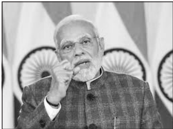
এ ধরনের মিথ্যা আখ্যান তৈরি করে, ভূয়া সমীক্ষা করে নিজেদের বড়াই করেছে।

বাম্মারি, ৫ মে (হি.স.): কর্ণাটকে বিধানসভা নির্বাচনের প্রচারে ফের একবার কংগ্রেসের বিরুদ্ধে আক্রমণ শানালেন প্রধানমন্ত্রী ও বিজেপি নেতা নরেন্দ্র মোদী। শুক্রবার কর্ণাটকের বাম্মারিতে কংগ্রেসের বিরুদ্ধে তোপ দেগে মোদী বলেছেন, কংগ্রেস সমাজ, দেশকে ধ্বংস করছে; সন্ত্রাসবাদ ও সন্ত্রাসীদের সমর্থন করছে। তিনি বলেছেন, কর্ণাটকের জনগণের পাশাপাশি গোটা দেশকে কংগ্রেস থেকে সাবধান থাকতে হবে। প্রধানমন্ত্রী বলেছেন, নির্বাচনে জেতার জন্য কংগ্রেস অর্ধের ভিত্তিতে মিথ্যা আখ্যান তৈরি করে। বিগত বেশ কিছু নির্বাচনে