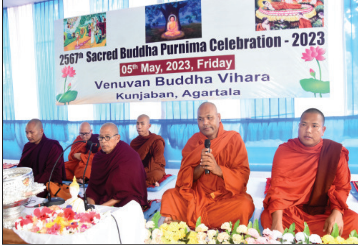
গুরুবার বুদ্ধ পূর্ণিমা উপলক্ষে আগরতলায় বেনুবন বিহারে বিশেষ আলোচনা সভায় বক্তব্য রাখছেন বৌদ্ধভিক্ষুরা।