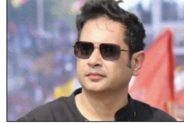
একটি রোড ম্যাপ তৈরি করতে ত্রিপুরা বিভিন্ন জনজাতি সম্প্রদায়ের প্রধানদের সাথে বৈঠকে অংশ নিয়েছেন। এদিন তিনি বলেন, আজ ১০ মে পুনরায় বৈঠক হবে এবং চই মে মধ্যস্থতাকারী ত্রিপুরা সফর করবেন। এদিকে, আজ তিনি মণিপুর সঙ্কটের প্রতিও প্রতিক্রিয়া

দিয়েছেন। তিনি মণিপুরে সহিংসতায় আটকে পড়া ত্রিপুরার শিক্ষার্থীদের বিমান ভাড়া বহন করতে প্রস্তুত বলে জানিয়েছেন। মণিপুরে মেইতি এবং কুকি সম্প্রদায়কে সহিংসতা থেকে নিজেদেরকে সংযত রাখার আবেদন জানিয়েছেন প্রদ্যোত।