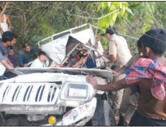
জোলাইবাড়িতে দুর্ঘটনায় নিহত ও আহতদের উদ্ধার করেছেন স্থানীয় জনগণ ও ফায়ার সার্ভিসের কর্মীরা।

নিজস্ব প্রতিনিধি, শান্তিবাজার, ১৭ মে। নিয়ন্ত্রন হারিয়ে মালবাহী গাড়ী রাস্তার পাশে খাটে ছিটকে পড়েছে। তাতে গাড়িতে থাকা তিন যাত্রী গুরুতর আহত হয়েছেন। স্থানীয়রা দুর্ঘটনার খবর পাঠিয়েছে জোলাইবাড়ীর দমকল কর্মীদের। দমকলকর্মীরা আহতদের উদ্ধার করে জোলাইবাড়ী সামাজিক স্বাস্থ্যকেন্দ্রে নিয়ে গিয়েছেন। হাসপাতালের কর্তব্যরত চিকিৎসক তাঁদের মধ্যে একজনকে মৃত বলে ঘোষণা দিয়েছেন। অপরদিকে বাকি দুইজন ব্যক্তির অবস্থা আশঙ্কাজনক দেখে একজনকে গোমতী জেলা হাসপাতালে ও অপরজনকে শান্তির বাজার জেলা হাসপাতালে স্থানান্তর করেছেন।