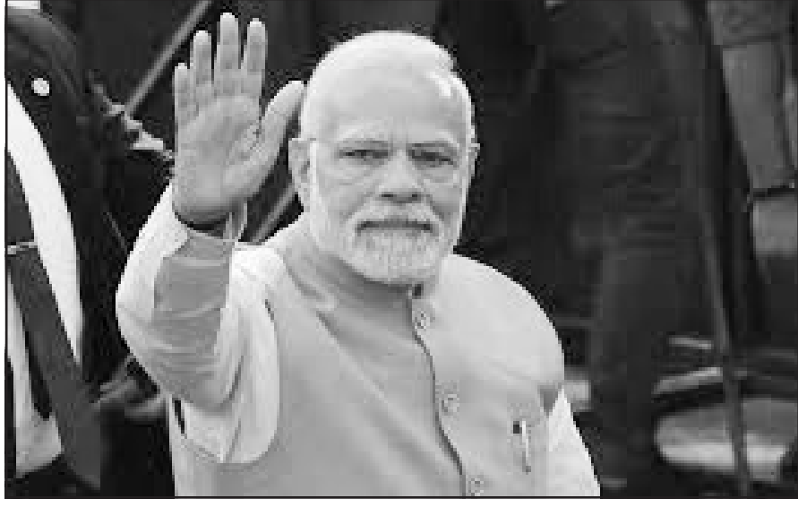
মহাসাগরীয় দ্বীপপুঞ্জের মধ্যে সহযোগিতা সংক্রান্ত তৃতীয় সম্মেলনে সভাপতিত্ব করবেন। শেষ ধাপে অস্ট্রেলিয়া যাবেন প্রধানমন্ত্রী। ২২ মে কোয়াড নেতাদের শীর্ষ সম্মেলনে অংশ নেবেন তিনি। অস্ট্রেলিয়ার প্রধানমন্ত্রী আর্নটন আলবার্নিজের সঙ্গে দ্বিপাক্ষিক বৈঠকে অংশ নেবেন শ্রী মোদী।

নয়াদিল্লি, ১৭ মে (হি.স.) : প্রধানমন্ত্রী নরেন্দ্র মোদী আগামী ১৯-২১ মে সময়কালে তিন দেশ সফরে রওনা হবেন। সফরকালে তিনি জাপান, পাপুয়া নিউ গিনি এবং অস্ট্রেলিয়ায় যাবেন। আগামী ১৯ থেকে ২১শে মে পর্যন্ত শ্রী মোদী, জাপানের হিরোশিমায় সেদেশের প্রধানমন্ত্রী ফুমিও কিশিদার আমন্ত্রণে জি সেভেন সম্মেলনে যোগ দেবেন। সম্মেলনে প্রধানমন্ত্রী, শান্তি, স্থিতি, খাদ্য, সার ও শক্তি নিরাপত্তার বিষয়ে অগ্রগতি নিয়ে সদস্য দেশগুলির সঙ্গে কথা বলবেন। সম্মেলনের ফীকে শ্রী মোদী, অংশগ্রহণকারী নেতৃবৃন্দের সঙ্গে দ্বিপাক্ষিক বৈঠক করবেন। বিদেশমন্ত্রক সূত্রে জানানো হয়েছে, সফরের দ্বিতীয় পর্যায়ে তিনি পাপুয়া নিউগিনিতে ভারত প্রশাস্ত