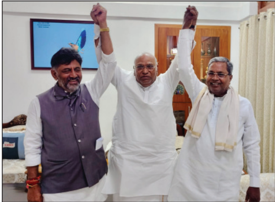
মুখ্যমন্ত্রী বাছাই নিয়ে বৈঠকের পর কংগ্রেস সর্বভারতীয় সভাপতি মল্লিকার্জুন খাড়াগের সাথে শিবকুমার (বামে) এবং সিদ্ধারামাইয়া (ডানে)

নির্বাচন শেষ না হওয়া পর্যন্ত কর্ণাটকের প্রদেশ কংগ্রেস সভাপতি হিসেবে দায়িত্ব পালন করবেন শিবকুমার। আগামী ২০ মে মুখ্যমন্ত্রী, উপ-মুখ্যমন্ত্রী