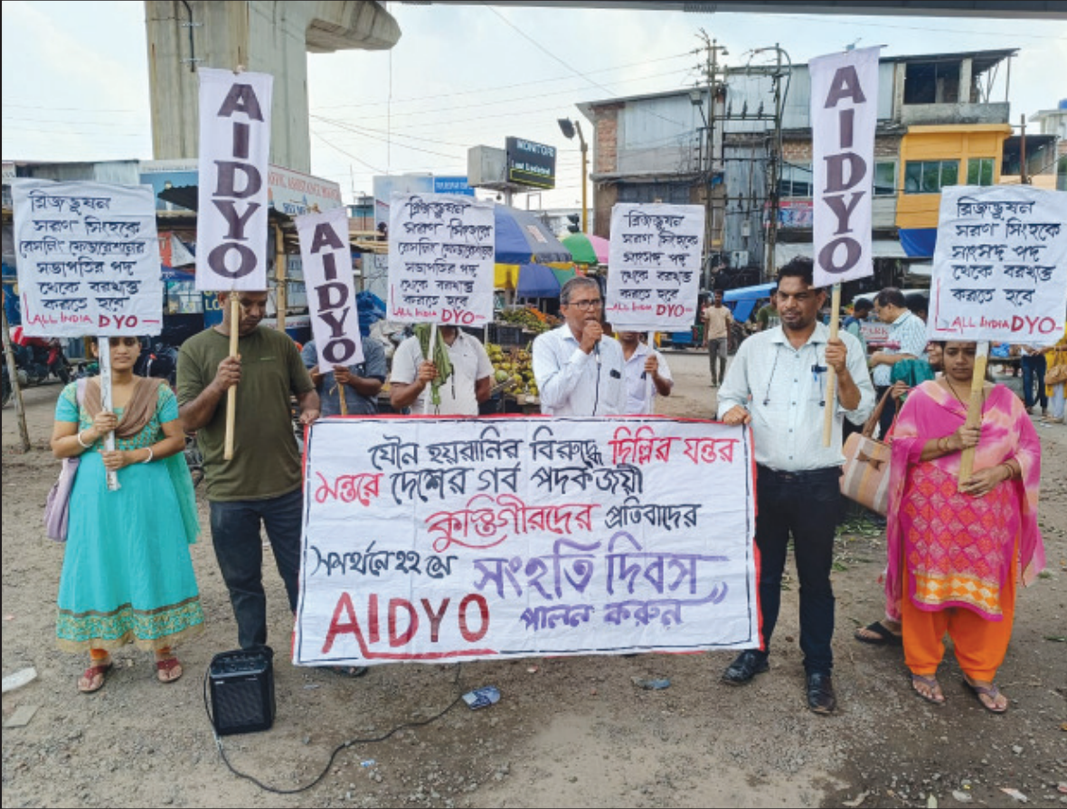
দিল্লীতে কুস্তীগীরদের সাথে যৌন হয়রানির প্রতিবাদে আগরতলায় এআইডিওএর বিক্ষোভ।