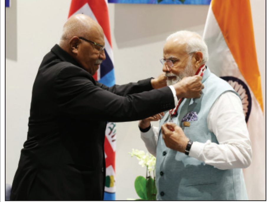
'কম্প্যানিয়ন অব দ্য অর্ডার অব ফিজি' সম্মানে সম্মানিত প্রধানমন্ত্রী নরেন্দ্র মোদী।

নয়া দিল্লি, ২২ মে (হি.স.)। আগামীকাল মঙ্গলবার থেকে ২,০০০ টাকার নোট বদলের প্রক্রিয়া শুরু হবে। তবে এনিয়ে ছড়োছড়ির কোনও দরকার নেই। সাধারণ মানুষকে আশ্বস্ত করলেন আরবিআই গভর্নর শক্তিকান্ত দাস। সোমবার তিনি জানান, বাজারে থাকা সব ২,০০০ টাকার নোট বদলে দেওয়ার মতো টাকা ব্যাংকগুলির কাছে আছে। ৩০ সেপ্টেম্বরের ডেডলাইন আদতে প্রক্রিয়া মসৃণ করার জন্য ধারা করা হয়েছে। এরই মধ্যে এসবিআই ঘোষণা করে জানিয়েছে, একবারে কোনও পরিচয়পত্র ছাড়াই ১০টি ২০০০ টাকার নোট বদল করা যাবে। তবে ব্যাংকে নোট বদল শুরুর আগে অনেকেই পেট্রোল পাম্পে ২,০০০ টাকার নোট বদলের চেষ্টা চালাচ্ছেন। অনেকক্ষেত্রে আবার পাম্পের ৩৬ এর পাতায় দেখুন ইন্টারলোকেটর নিয়ে ধোঁয়াশায় রাজ্যবাসী