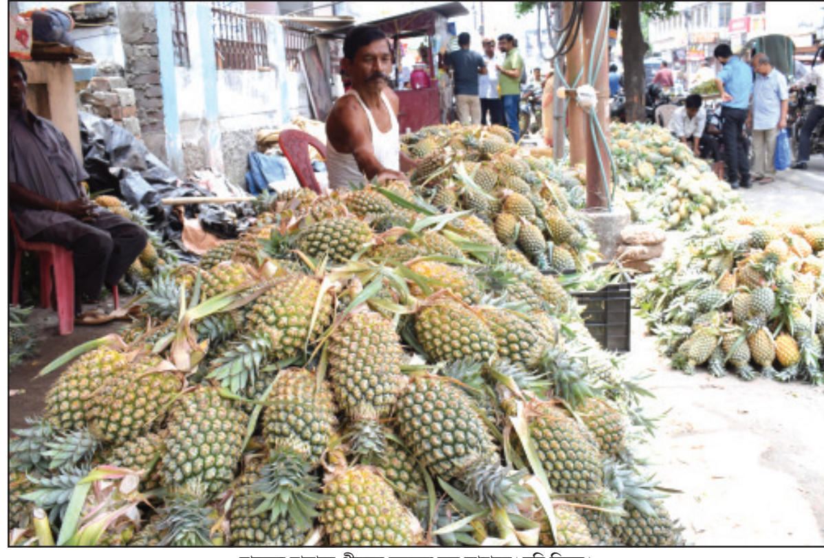
রাজ্যের বাজারে গ্রীষ্মের অন্যতম ফল আনারস।

রাজ্যের প্রতিটি গ্রামে ক্রমাগত যোগব্যায়াম এবং ধ্যানের কাজ করছে। কেন্দ্রীয় সরকারের সংস্কৃতি মন্ত্রক এ বছর "হর দিল ধ্যান, হর দিন ধ্যান" কর্মসূচি শুরু করেছে। এই থিমের উপর প্রতিষ্ঠান প্রতিটি গ্রাম পঞ্চায়েতে জন অভিয়ান পরিষদের সাথে তার কার্যক্রম শুরু করেছে। ২১ শে জুন আন্তর্জাতিক যোগ দিবসের কর্মসূচিতে অংশ নিতে আয়ুর্ষ বিভাগ দ্বারা জনসাধারণকে নিবন্ধিত করা হচ্ছে।