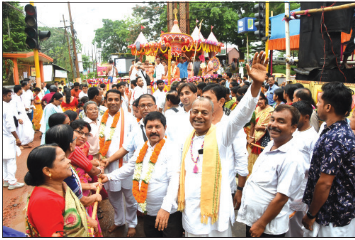
আগরতলায় উল্টো রথ ঘিরে ব্যাপক উল্লাস। বুধবার তোলা ছবি নিজস্ব।