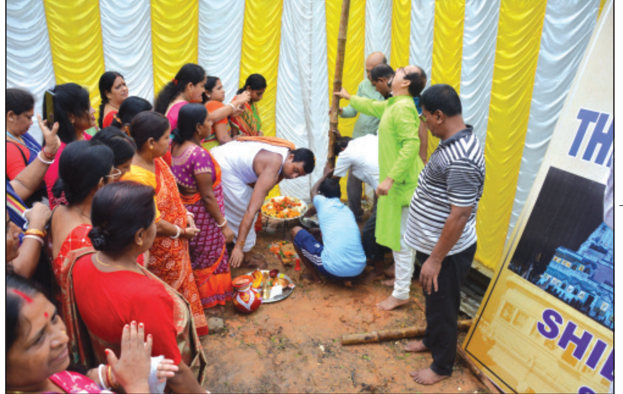
শিবনগর মর্ডান ক্লাব ও আমার তরুণ দলের শারাদৎসবের পূজা প্যাডেলের খুঁটি পূজা অনুষ্ঠিত হয়েছে বুধবার।