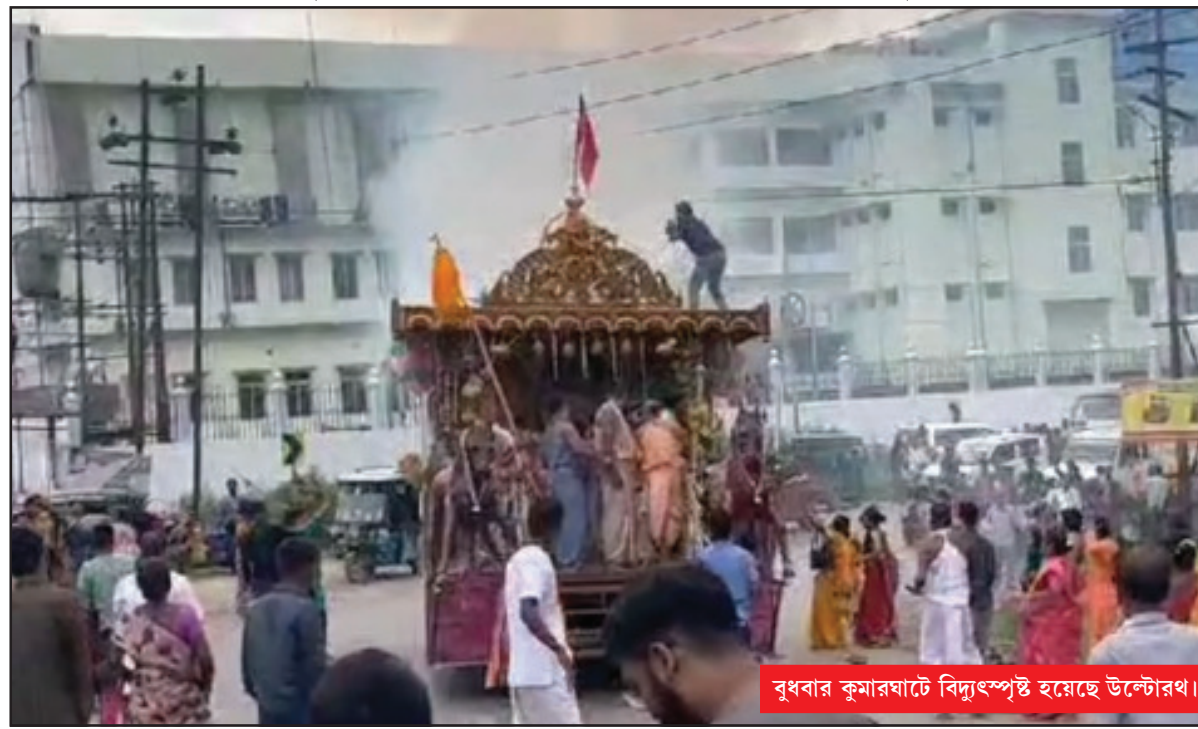
বৃহত্তর কুমারঘাটে বিদ্যুৎস্পৃষ্ট হয়েছে উল্টোরথ।

কুমারঘাটে এই প্রথম ইসকন বড় আকারে রথের আয়োজন করেছে। স্বাভাবিকভাবেই উল্টো রথে মানুষের উপচে পড়া ভীড় ছিল দেখার