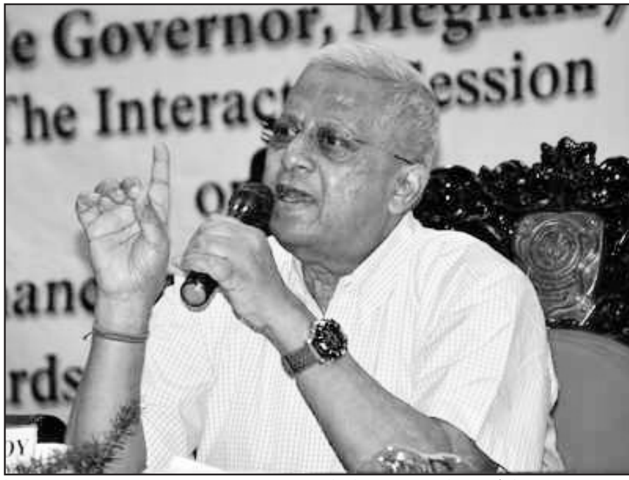
উপাচার্য নিয়োগ করেছেন, তা আলোচনা ছাড়াই উপাচার্য হাইকোর্টে এই সংক্রান্ত মামলায় বৈধ নয়। রাজ্যের উচ্চ শিক্ষা নিয়োগে এককভাবে সিদ্ধান্ত নিয়ে চলছেন আচার্য। যদিও কলকাতা শীর্ষ আদালতের দ্বারস্থ হয়।