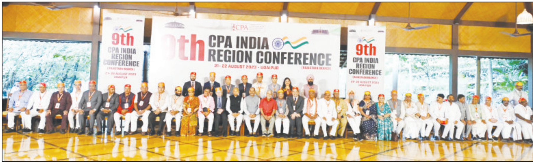
রাজস্থানের উদয়পুরে নবম সিপিএ ইন্ডিয়া রিজিওন কনফারেন্সের উদ্বোধনী অনুষ্ঠানে উপস্থিত ছিলেন লোকসভার স্পিকার ওম বিড়লা সহ বিশিষ্টজনেরা।