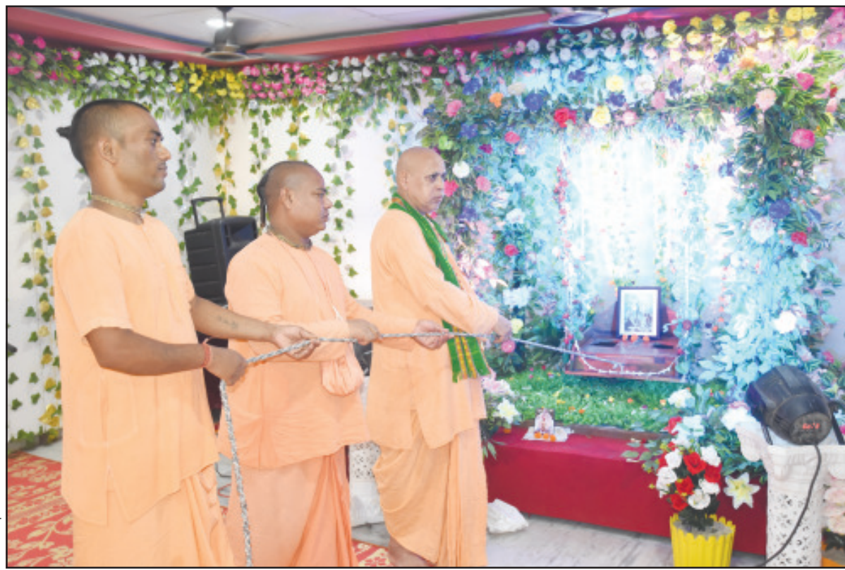
ইসকন মন্দিরে চলাছে ভক্তিবরে বুলনামাত্রা।