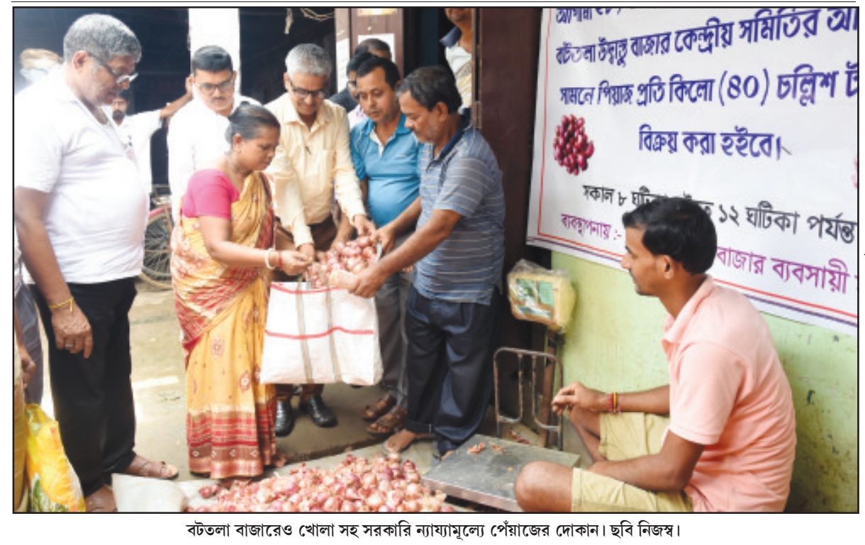
বটতলা বাজারেও খোলা সহ সরকারি ন্যায্যামূল্যে পোষাকের দোকান।