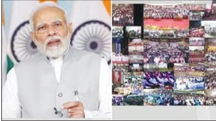
পিআইবি-র বিজ্ঞপ্তি অনুসারে আরও জানা গিয়েছে, সারাদেশে ৪৫টি স্থানে এই চাকরি মেলার আয়োজন করা হয়েছে। যদিও এই চাকরি মেলার মূল অনুষ্ঠানটি হয় মাদ্রাসা, স্বরাষ্ট্রমন্ত্রক বিভিন্ন কেন্দ্রীয় সশস্ত্র পুলিশ বাহিনী (সিএপিএফ) যেমন সেন্ট্রাল রিজার্ভ পুলিশ ফোর্স (সিআরপিএফ), বর্ডার সিকিউরিটি ফোর্স (বিএসএফ), সশস্ত্র সীমা বল (এসএসবি), আসাম রাইফেলস এবং নন-জেনারেল ডিউটি ক্যাম্পার পদের মতো বিভিন্ন ক্যাটাগরির পদের কাজ করবেন। কর্মসংস্থান সৃষ্টিকে সর্বোচ্চ অগ্রাধিকার দেওয়ার যে প্রতিশ্রুতি প্রধানমন্ত্রী করেছিলেন, রোজগার মেলা তার একটি বড় পদক্ষেপ।

নয়া দিল্লি, ২৮ আগস্ট (হিস) : প্রধানমন্ত্রী নরেন্দ্র মোদী সোমবার ৫১ হাজারের বেশি কর্মচারীকে নিয়োগপত্র তুলে দেন। সোমবার সকাল সাড়ে ১০টা নাগাদ তিনি ভিডিও কনফারেন্সের মাধ্যমে এই নিয়োগপত্র প্রদান করবেন। সরকারি চাকরিতে নতুন নিযুক্ত হওয়া প্রায় ৫১ হাজার যুবককে এই নিয়োগপত্র তুলে দেন প্রধানমন্ত্রী নরেন্দ্র মোদী। এদিনের অনুষ্ঠানে নবনিযুক্ত সরকারী কর্মচারীদের উদ্দেশ্যে ভাষণও দেবেন তিনি। কেন্দ্রীয় সরকারের প্রেস ইনফরমেশন ব্যুরো (পিআইবি)-র একটি বিজ্ঞপ্তি অনুসারে এই তথ্য জানা গিয়েছে।