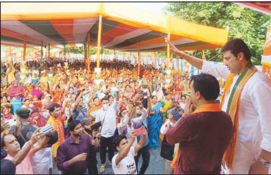
প্রচারে উপস্থিত ছিলেন সাংসদ জন্ম তিনি প্রচার চালান। তিনি বিপ্লব কুমার দেব। এদিন ধনপুত্রের নির্বাচনে প্রতিমা ভৌমিককে একমাত্র ৬ এর পাতায় দেখুন

নিজস্ব প্রতিনিধি, আগরতলা, ২৮ আগস্ট। ২০২৪ সালে ফের প্রধানমন্ত্রী হচ্ছেন নরেন্দ্র মোদী। ত্রিপুরা থেকে বার্তা দেওয়া হবে ২০২৪ সালে নরেন্দ্র মোদীই পুনরায় প্রধানমন্ত্রী হচ্ছেন। মোদী কে শক্তিশালী করতে হবে, ভারতকে শক্তিশালী করতে হবে। তবেই ধনপুত্র ও শক্তিশালী হবে সোমবার ধনপুত্র উপ নির্বাচনের প্রচারে একথা বলেন সাংসদ বিপ্লব কুমার দেব।