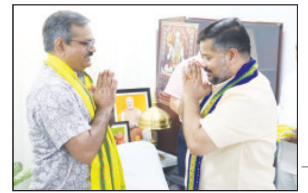
পরিদর্শন করে এয়ারপোর্ট অথরিটি অব ইণ্ডিয়ার আধিকারিকরা কৈলাসহর বিমানবন্দর পরিদর্শন করতে এয়ারপোর্ট অথরিটি অব ইণ্ডিয়ার আধিকারিকরা কৈলাসহর আসছেন।