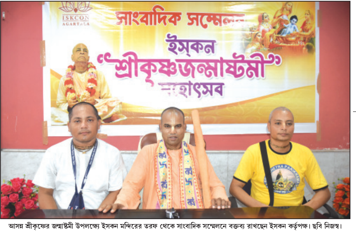
আসম শ্রীকৃষ্ণের জন্মাস্তমী উপলক্ষে ইসকন মন্দিরের তরফ থেকে সাংবাদিক সম্মেলনে বক্তব্য রাখছেন ইসকন কর্তৃপক্ষ।