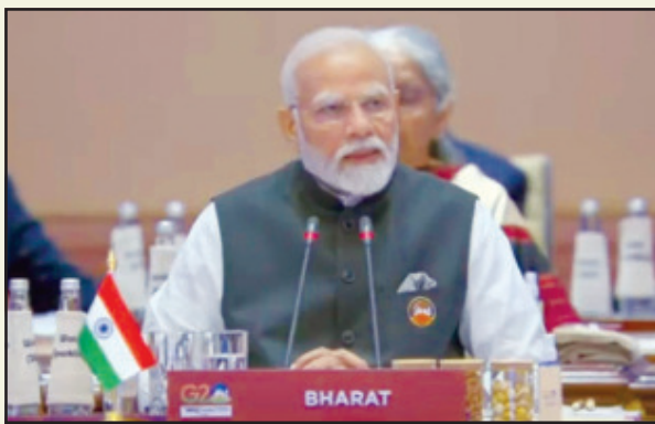
প্রধানরা উপস্থিত ছিলেন। এই সম্মেলনেই ইন্ডিয়ার পরিবর্তে মোদীর সামনে রাখা ছিল ভারত লেখা প্লেট।

নয়া দিল্লি, ৯ সেপ্টেম্বর (হি.স.): দেশের নাম নিয়ে দেশজুড়ে আলোচনা ও বিতর্ক জারি হয়েছে। তার মধ্যেই জি-২০ সম্মেলনে দেশের নাম হিসেবে বিশ্ব নেতাদের সামনে 'ভারত' উল্লেখ করা হয়েছে। প্রধানমন্ত্রী নরেন্দ্র মোদীর সামনে ভারত লেখা প্লেট দেখা গিয়েছে। ভারতের পৌরহিত্যে শনিবার দিল্লির প্রগতি ময়দানের ভারত মণ্ডপে মঞ্চ হয়েছিল জি-২০ শিখর সম্মেলন। এই সম্মেলনে জি-২০ সদস্যভুক্ত দেশের রাষ্ট্র