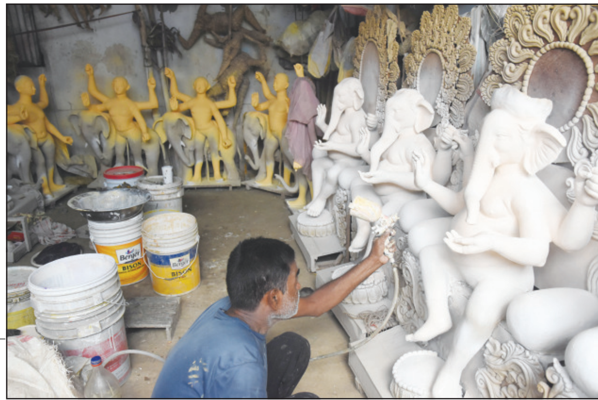
গণেশ পূজার হাতে গোনা আর কয়েকদিন বাকি। তাই মূর্তিপাড়ায় চলছে চরম ব্যস্ততা।

খামার থেকে একটু এগিয়ে গেলে এই জনপদ পাওয়া যাবে। এই পাড়ায় যেতে যোগাযোগের জন্য একটি রাস্তা থাকলেও তাও বেহাল, গ্রামের প্রবেশমুখে একটি ব্রেইলি করছে, উত্তর সোনাইছরি সালেফা, কোনো সংস্কার নেই। ব্রীজটি এমন অবস্থায় দাঁড়িয়েছে যে কোনো সময় বড় ধরনের বিপদের সম্ভাবনা রয়েছে, অথচ এই ভগ্নাংশ ব্রীজটির উপর দিয়ে ছোট ছোট শিশু সহ গ্রামের ৩৬ এর পাতায় দেখুন