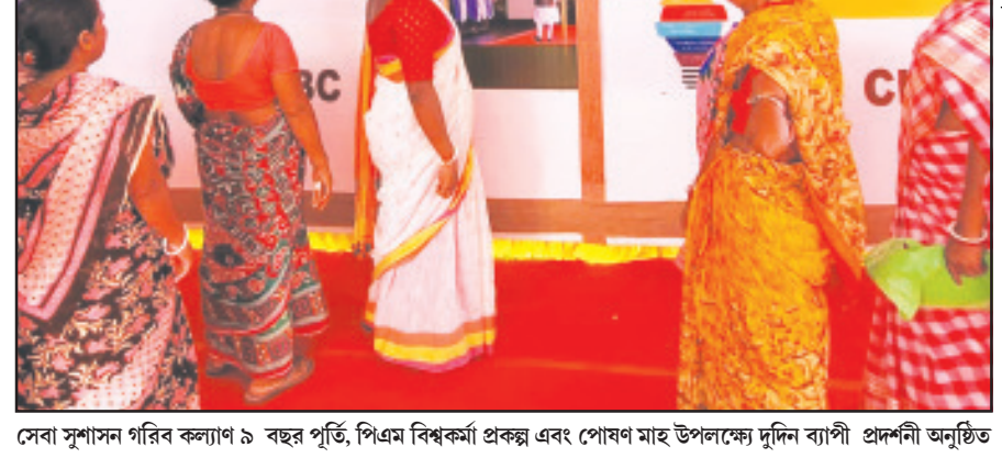
সেবা সূশাসন পরিষ কল্যাণ ৯ বছর পূর্তি, পিএম বিশ্বকর্মা প্রকল্প এবং পোষা মাছ উল্লেখ্যে দুর্দিন ব্যাপী প্রশস্নী অনুষ্ঠিত

মাছের চাষিরা অনুসারে মাছের প্রজননে বিস্তার ফরার রয়েছে। তাই সুবিধাভোগীদের মধ্যে মাছের চারাপোনা বিতরণ করে মাছের চাষিরা বাড়ানোর প্রচেষ্টা করা। এদিন সুবিধাভোগীদের হাতে মেয়র মাছের পোনা তুলে দিয়েছেন। আগামী দিনে এর মাধ্যমে রাজ্যে মৎস্যের জেগান আরো কয়েকগুণ বৃদ্ধি পাবে বলে ধারণা করা যাচ্ছে এবং এর ফলে স্ব নির্ভর হবেন মৎস্য চাষিরাও।