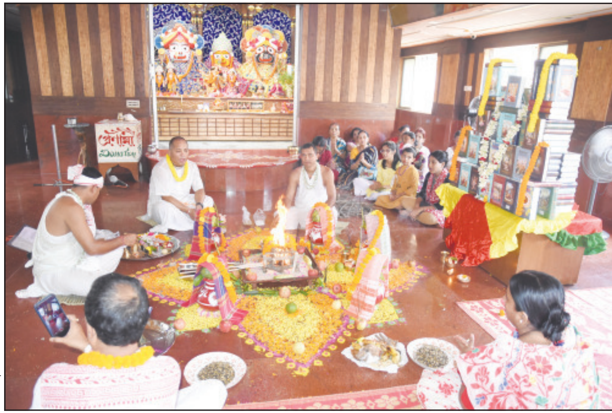
ভাদ্র পূর্ণিমা উপলক্ষে আগরতলা ইসকন মন্দিরে বিশেষ যজ্ঞের আয়োজন করা হয়।