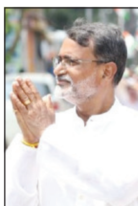
তিনি বলেন এই জাতি গোষ্ঠীর মানুষের অধিকার প্রতিষ্ঠিত করতে গোটা দেশেই আন্দোলন কর্মসূচী হাতে নিয়েছে কংগ্রেস। এদিনের সভায় বক্তব্য রাখতে গিয়ে উনার কথায় রাজ্যের মানুষের ভরসা এখন একমাত্র কংগ্রেস।