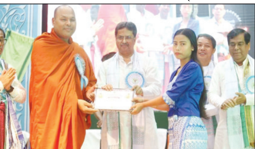
কোনও ধর্ম হয় না। আমাদের সর্বপ্রথম পরিচয় আমরা মানুষ। তাই সমাজের উন্নয়নে আমরা সবাই মানুষ হিসেবে আমাদের মানবিক এক। সঙ্কৃতি থাকলেও দেশ, রাজ্য ও বাস্তবায়িত সরকারের বিভিন্ন উদ্যোগসমূহ তুলে ধরে বলেন, দায়িত্ব রয়েছে। ভিন্ন ভিন্ন কৃষ্টি ও অনুষ্ঠানে মুখ্যমন্ত্রী রাজ্যের

নিজস্ব প্রতিনিধি, আগরতলা, ১৫ অক্টোবর।। বৈচিত্র্যের মধ্যে একা আমাদের রাজ্যের চিরন্তন ঐতিহ্য। এই বৈচিত্র্যময় কৃষ্টি, সংস্কৃতি ও পরম্পরার মধ্যেই লুকিয়ে আছে ঐক্যের রতন। জাতি ও জনজাতিদের পৃথক পৃথক ভাষা, পোশাক থাকা সত্ত্বেও আমরা সবাই এক ও অভিন্ন। দেশ, রাজ্য ও সর্বোপরি সমাজ গঠনে আমরা সবাই ঐক্যবদ্ধ। আজ আগরতলা টাউন হলে সোসাইটি ফর ওয়েলফেয়ার অব মগ সোসাইটি স্টুডেন্টস কর্তৃক আয়োজিত ১৭তম মেধা পুরস্কার ও নবীন বরণ অনুষ্ঠানে মুখ্যমন্ত্রী প্রফেসর (ডা.) মানিক সাহা একথা বলেন। অনুষ্ঠানে মুখ্যমন্ত্রী প্রধান অতিথি হিসেবে উপস্থিত ছিলেন। মুখ্যমন্ত্রী বলেন, রক্তের যেমন কোনও ধর্ম হয় না, তেমনি মানবতারও