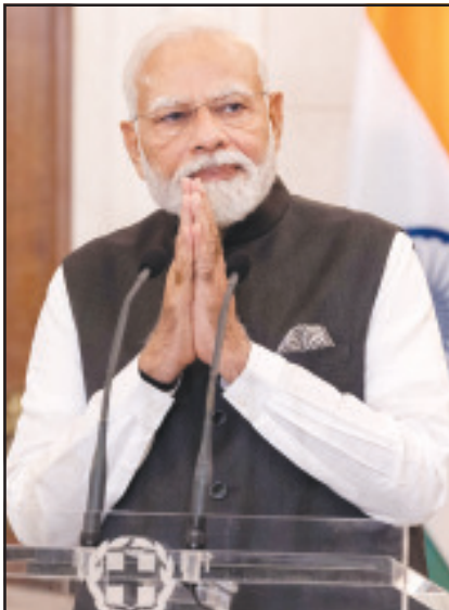
নয়াদিল্লি: ২৭ অক্টোবর: আগামী ২৮ অক্টোবর ২০২৩ দুপুর একটায় ভিডিও কনফারেন্সিং এর মাধ্যমে নতুন নিয়োগপ্রাপ্তদের একমাত্র হাজারেরও বেশী চাকুরী নিয়োগ পত্র বিতরণ করবেন

প্রধানমন্ত্রী শ্রী নরেন্দ্র মোদি। এই অনুষ্ঠানের মধ্য দিয়ে প্রধানমন্ত্রী নতুন নিয়োগকারীদের সম্বোধন করবেন। সারা ভারতে ৩৭ টি জায়গায় রোজগার মেলা অনুষ্ঠিত হবে। কেন্দ্র সরকারের বিভিন্ন দপ্তরে এই নিয়োগগুলি হবে, পাশাপাশি রাজ্য সরকার ও কেন্দ্রশাসিত অঞ্চলগুলিও এই উদ্যোগকে সমর্থন করেছে। সারা দেশ থেকে নির্বাচিত নতুন নিয়োগ কারীরা রেল মন্ত্রণালয়, ডাক বিভাগ, স্বরাষ্ট্র মন্ত্রণালয়, স্বাস্থ্য এবং পরিবার কল্যাণ মন্ত্রক রাজস্ব বিভাগ, উচ্চ শিক্ষা বিভাগ এবং স্কুল শিক্ষা ও সাক্ষরতা বিভাগ সহ বিভিন্ন সরকারি মন্ত্রণালয়/বিভাগে যোগদান করবেন। ভারতবর্ষে কর্মসংস্থান সৃষ্টিকারী অগ্রাধিকার দেওয়ার জন্য প্রধানমন্ত্রীর প্রতিশ্রুতি পূরণের পথে আরও একটি পদক্ষেপ। রোজগার মেলা আরো বেশি কর্মসংস্থান সৃষ্টিতে অনুঘটক হিসেবে কাজ করবে এবং তরুণদের ক্ষমতায়ন ও জাতীয় উন্নয়নে অংশগ্রহণের জন্য অর্থবহ সুযোগ দেবে বলে আশা করা হচ্ছে। নতুন নিয়োগপ্রাপ্তরা আই-গেট (জঙ্ক ও স্ট্র) কর্মযোগী পোর্টালের অনলাইন মডিউল কর্মযোগী প্রারম্ভ এর মাধ্যমে নিজেদের প্রশিক্ষণের সুযোগও পাচ্ছেন যেখানে "যেকোনো জায়গায় যেকোনো ডিভাইস" কে শেখার পদ্ধতির জন্য ৭৫০ টিরও বেশি ই-লার্নিং কোর্স উপলব্ধ করা হয়েছে।