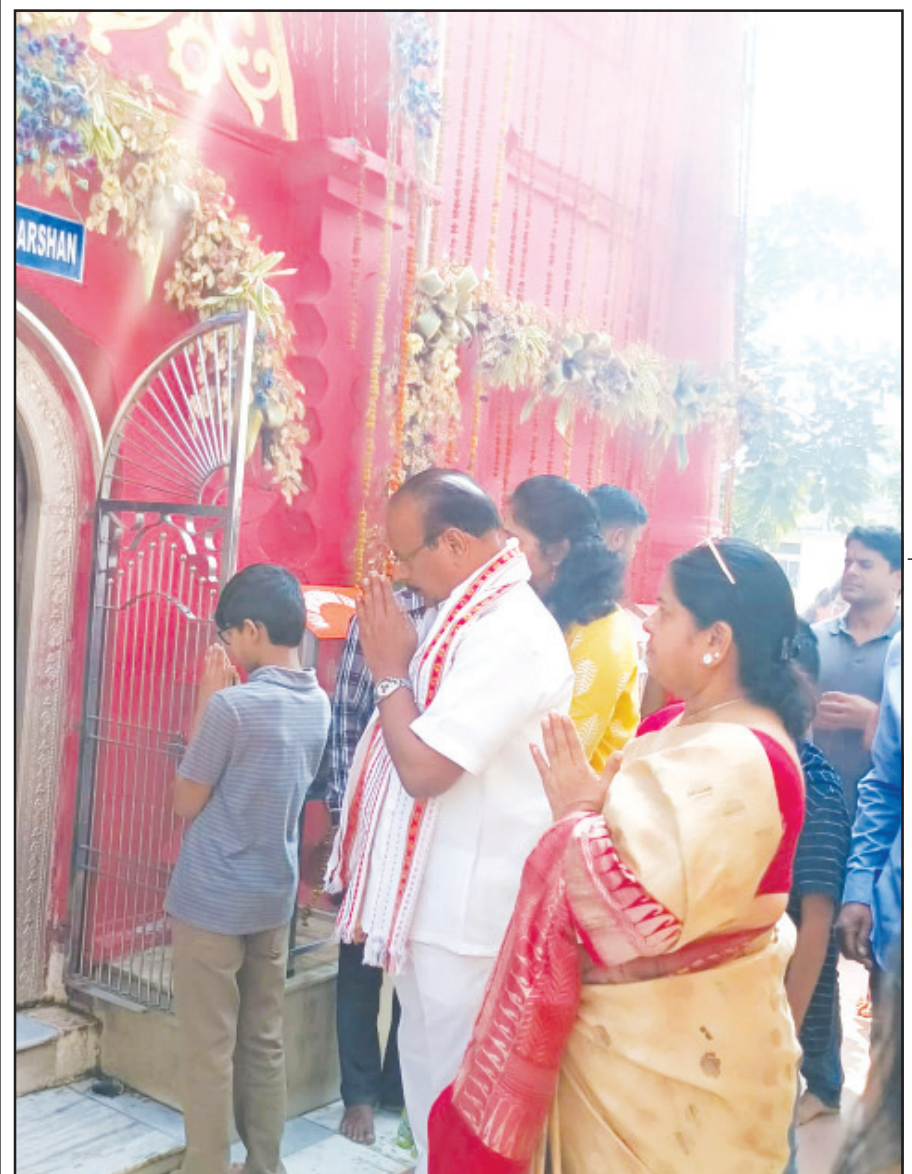
শুক্লাবত্রিশপুরেশ্বরী মন্দিরে সন্নীক পূজা দিলেন রাজ্যপাল ইন্দ্রসেনা রেড্ডি নাথু।

নয়াদিল্লি, ২৭ অক্টোবর।। প্রধানমন্ত্রী নরেন্দ্র মোদি তাঁর প্রাপ্ত স্মারক গুলির নিলামে নাগরিকদের যুক্ত হতে নিলামের ডাক দিয়ে সেই স্মারক গুলি জিতে নিতে উৎসাহিত করেন। শ্রী মোদি জানিয়েছেন যে, এর থেকে যা আয় হবে তা 'নামামি গঙ্গে' কে উৎসর্গ করা হয়েছে। তিনি তার এক পোস্টে এই বিষয়ে বিস্তারিত তুলে ধরেছেন। প্রধানমন্ত্রী এক পোস্টে লিখেছেন: 'আমি বছরের পর বছর ধরে যে স্মারক গুলি পেয়েছি তার নিলামে স্বতঃস্ফূর্ত সাদা দেখে আমি বাস্তবে সত্যি আনন্দিত। যেমনটা আপনারা জানেন, প্রাপ্ত আয় নামামি গঙ্গে কে উৎসর্গ করা হয়েছে। আমি অনুগ্রহপূর্বক সকলকে এতে অংশগ্রহণ করতে এবং আমার প্রাপ্ত কিছু স্মারক গুলির জন্য নিলামে ডাক দিতে উৎসাহিত করছি।'