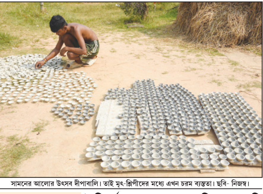
সামনের আলোর উৎসব দীপাবলি। তাই মুং-গ্লিপীদের মধ্যে এখন চরম ব্যস্ততা।

বিজ্ঞপ্তিতে আরও বলা হয়েছে, সেক্ষেত্রে প্রাণী সম্পদ বিকাশ দপ্তরের আধিকারিকরা বহিঃরাজ্য থেকে আমদানিকৃত শূকরগুলির প্রয়োজনীয় স্বাস্থ্য ও টিকা সংক্রান্ত অবস্থা যাচাই করবেন। সেখানে প্রশ্নে দ্বারা শূকর ব্রোভাই কনসাইনমেন্ট পৌঁছানোর কমপক্ষে ৪৮ ঘণ্টা আগে প্রাণীসম্পদ বিকাশ দপ্তরের অধিকর্তাকে জানাতে হবে। শূকর পালন ছাড়া আর্থিক কারণে মাংস বিক্রির জন্যও বহিঃরাজ্য থেকে শূকর আনা যাবে না। তাছাড়া যে স্থানে সেই শূকর যাবে সেখানে আমদানিকারী তার নিজের খরচে শূকরের স্বাস্থ্য পরীক্ষা করাবেন প্রাণীসম্পদ বিকাশ দপ্তরের আগাম অবগতির ভিত্তিতে। তাছাড়া রাজ্যের প্রবেশ দ্বারে যদি কোনও ব্রোভাইনি, অসুস্থ কনসাইনমেন্ট পাওয়া যায় তাহলে শূকরের কনসাইনমেন্ট রাজ্য থেকে সরিয়ে নেওয়ার একমাত্র দায়িত্ব থাকবে আমদানিকারী। অন্যথায় তাকে নিজের খরচে চলতি রোগ প্রতিরোধক আইন অনুযায়ী সেই শূকরগুলির সঠিক নিষ্পত্তি করতে হবে।