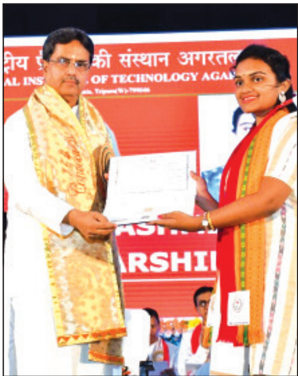
না ভুলেও বিশ্ব দরবারে প্রতিযোগিতার উপযোগী হয়ে উঠতে সক্ষম হবে। মুখ্যমন্ত্রী বলেন, রাজ্য সরকার এনআইটি আগরতলার অভিব্যক্তিকে এগিয়ে নিয়ে যেতে অঙ্গীকারবদ্ধ।

নিজস্ব প্রতিনিধি, আগরতলা, ৪ নভেম্বর। শিক্ষা পরিবর্তন, আর্থিক, সামাজিক ও সাংস্কৃতিক ভেদাভেদ দূর করার সবচেয়ে বড় হাতিয়ার। প্রধানমন্ত্রী নরেন্দ্র মোদি বলেছেন, 'পৃথিবীতে পরিবর্তন আনার জন্য শিক্ষাই হচ্ছে সবচেয়ে শক্তিশালী অস্ত্র'। এনআইটি - আগরতলায় প্রধানমন্ত্রীর কথারই প্রতিফলন দেখা যায়। আজ এনআইটি আগরতলার অটল বিহারী বাজুপেথী স্পোর্টস কমপ্লেক্সে ১৬তম সমাবর্তন অনুষ্ঠানে মুখ্যমন্ত্রী প্রফেসর (ডা.) মানিক সাহা একথা বলেন। অনুষ্ঠানে মুখ্যমন্ত্রী বলেন, আমাদের লক্ষ্য শুধু শিক্ষা প্রদান নয়, দেশের ভাগ্য নির্ধারণে অংশগ্রহণ করা। রাজ্য সরকার ত্রিপুরাকে উত্তর-পূর্বাঞ্চলের মধ্যে শিক্ষামূলক হাব রূপে গড়ে তোলার উদ্যোগ নিয়েছে। এজন্য সমাজে পিছিয়ে পড়াবাদের জন্য ক্ষমারশিপ চালাই।