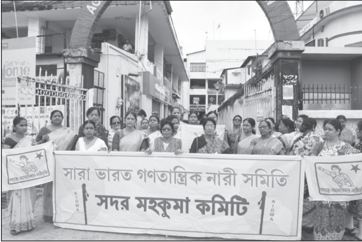
শনিবার আগরতলা পুর নিগমের সামনে সারা ভারত গণতান্ত্রিক নারী সমিতির উদ্যোগে এক র্যালির আয়োজন করা হয়।