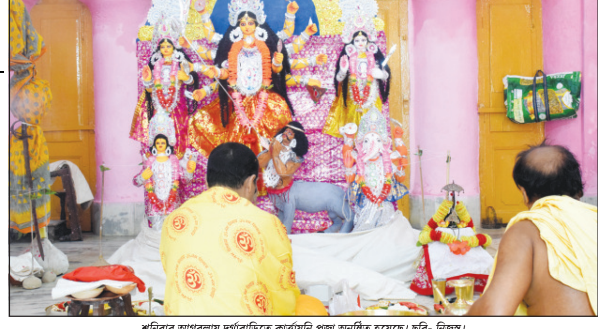
শনিবার আগরলায় দুর্গাবাড়িতে কার্ভায়নি পূজা অনুষ্ঠিত হয়েছে।