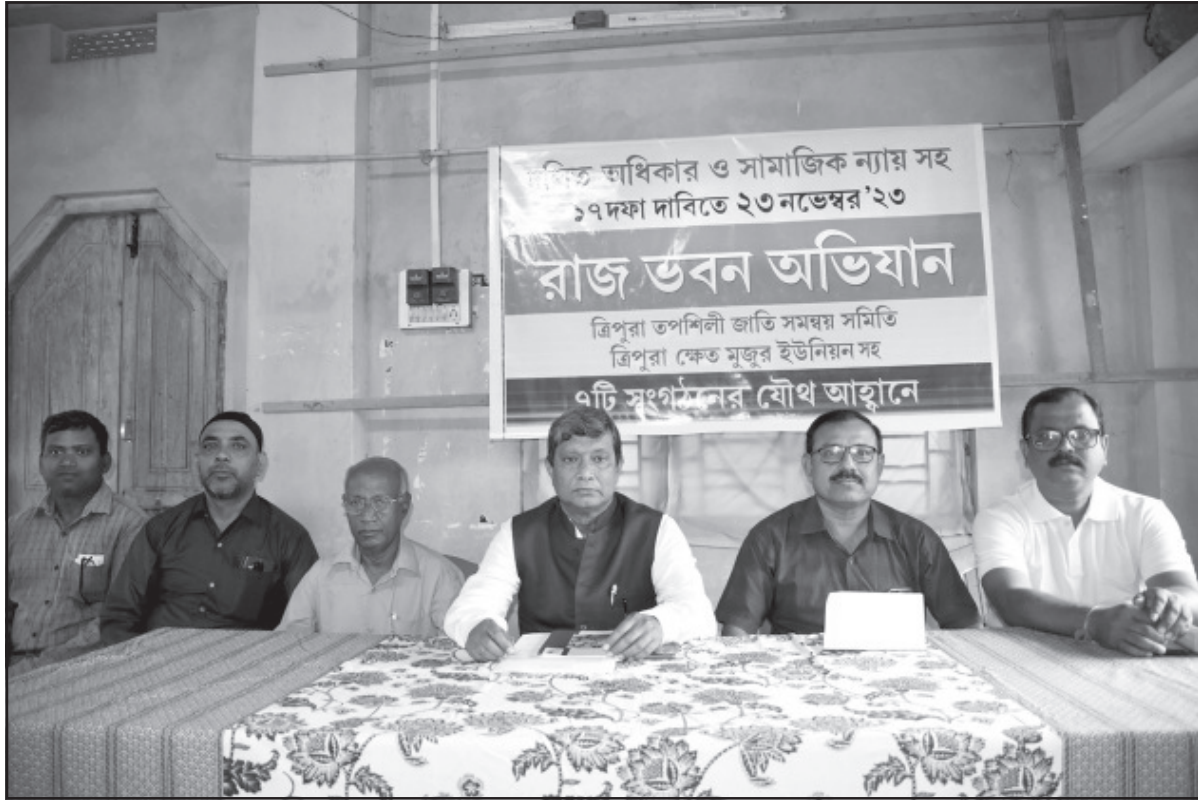
শনিবার ত্রিপুরা তপশিলী জাতি সমন্বয় সমিতির উদ্যোগে আহত এক সাংবাদিক সম্মেলনের আয়োজন করা হয়।