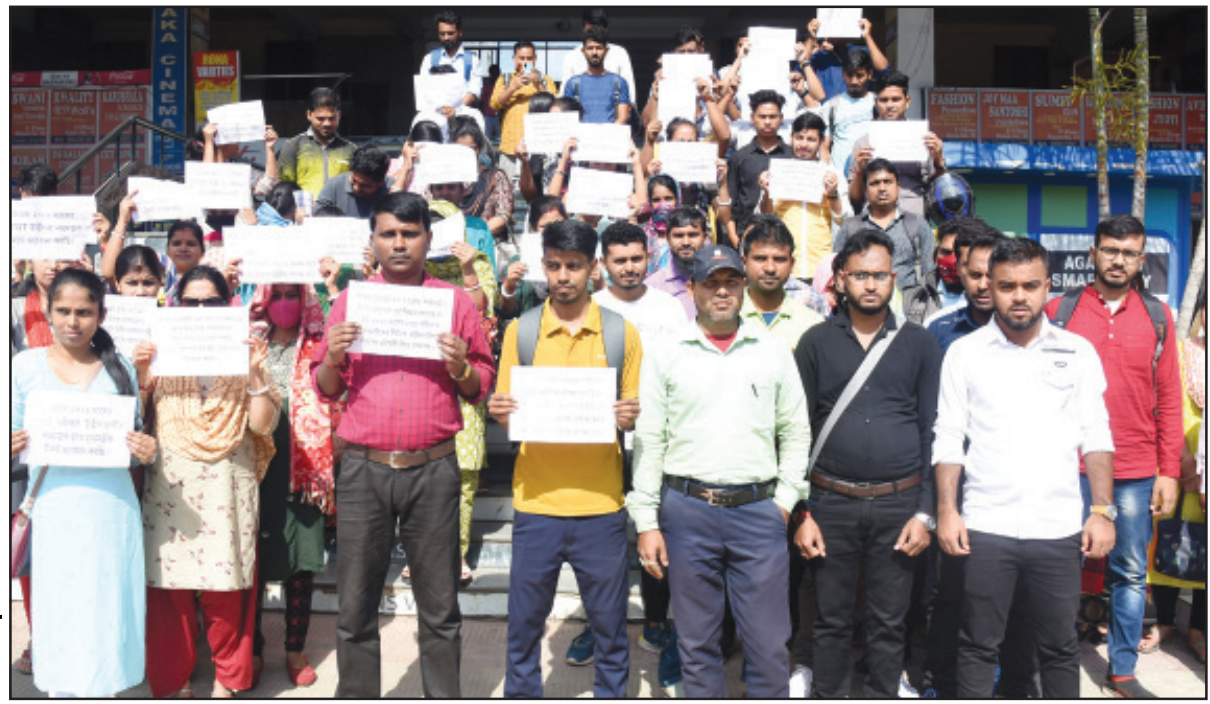
ফল প্রকাশের দাবিতে বিক্ষোভ এসটিজিটি পরীক্ষার্থীদের।