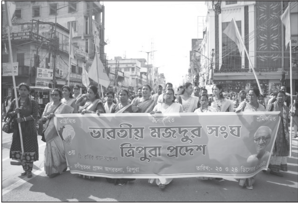
শনিবার ভারতীয় মজদুর সংঘের উদ্যোগে এক র্যালি আয়োজিত হয়।