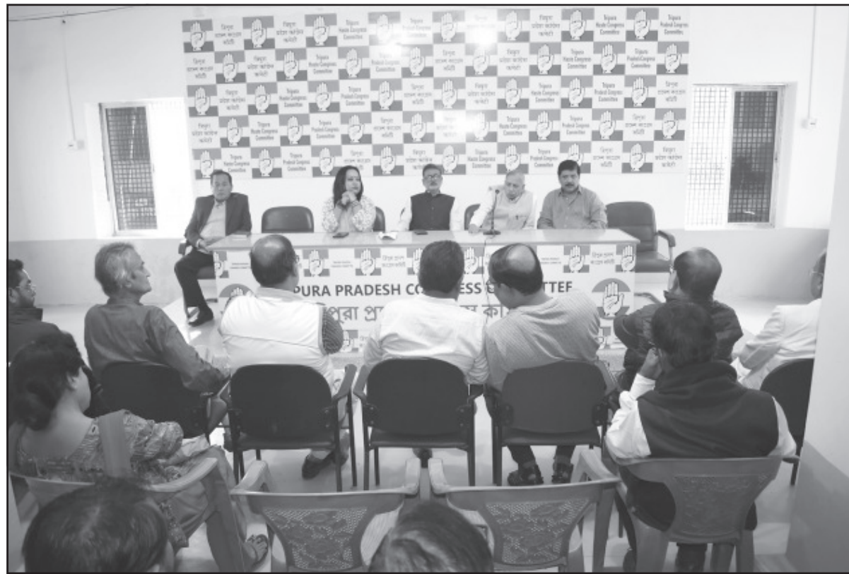
শনিবার কংগ্রেসের লিগাল সেলের এক বৈঠক অনুষ্ঠিত হয়।