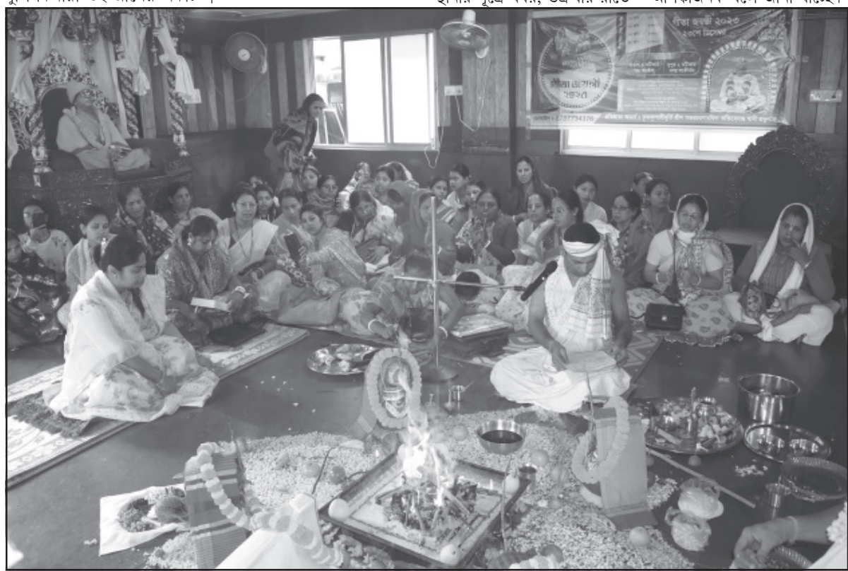
শনিবার রাজধানীতে গীতা যজ্ঞের আয়োজন করা হয়।