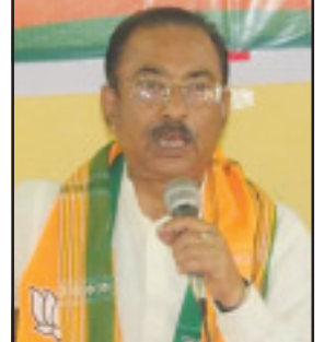
ভোটে জয়লাভ করার জন্য ভারতীয় জনতা পার্টির বৃথ-স্তরের