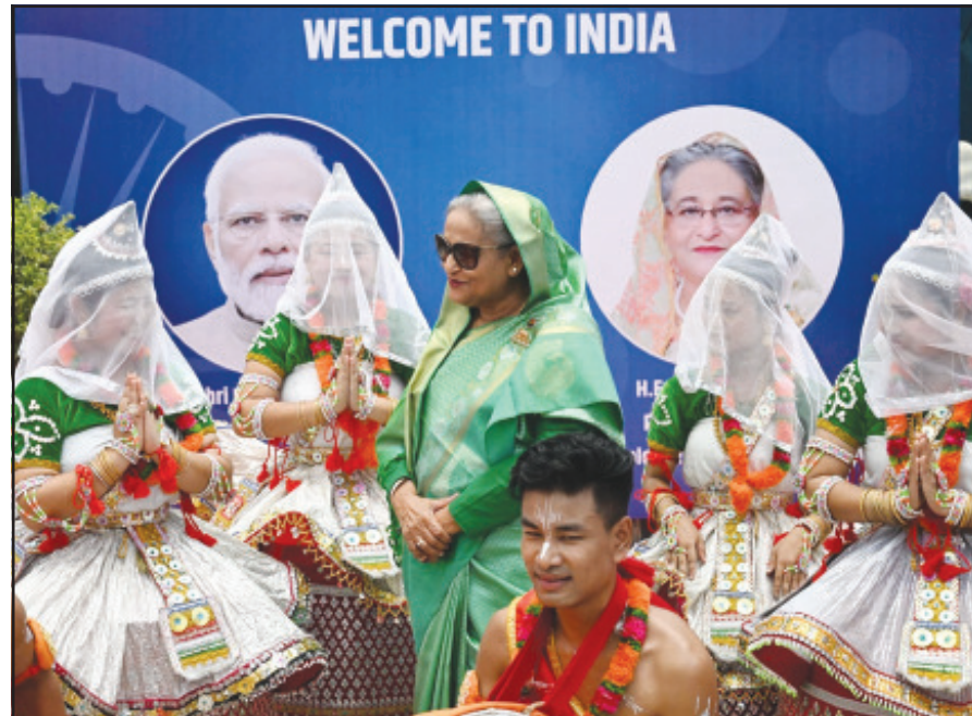
প্রধানমন্ত্রী হিসেবে নরেন্দ্র মোদীর শপথ সমারোহে অংশ নিতে আজ নয়া দিল্লিতে এসেছেন বাংলাদেশের প্রধানমন্ত্রী শেখ হাসিনা। তাঁকে বিমানবন্দরে স্বাগত জানানো হয়েছে।

নিজস্ব প্রতিনিধি, আগরতলা, ৮ জুন ৷ দৈনিক ৮ ঘণ্টা কাজের সময় ধার্য করা, মজুরি বৃদ্ধি, কাজের নিরাপত্তা দেওয়া সহ একাধিক দাবিতে সরব হয়েছেন বিদ্যুৎ লাইন সারাইয়ের কাজে যুক্ত কর্মীরা এবং গাড়ি চালকরা। আজ তাঁরা কর্মবিরতী করে ভূতুরিয়া বিদ্যুৎ নিগমের অফিসের সামনে বিক্ষোভে সামিল হয়েছেন। জমেক বিদ্যুৎ কর্মী জানিয়েছেন, গত তিন বছর যাবৎ ত্রিপুরা স্টেট ইলেকট্রিসিটি কর্পোরেশন লিমিটেডের সহযোগী সংস্থা ভিশন গ্রাসের অধীনে প্রায় দেড়শ জন লাইনম্যান ও গাড়ি চালক কাজে নিযুক্ত আছেন। বিদ্যুৎ দফতর থেকে বলা হয়েছিল তাঁদের প্রতিবছর বেতন বৃদ্ধি করা হবে। কিন্তু তিন বছর অতিক্রান্ত হলেও এখনো পর্যন্ত বেতন বৃদ্ধি হয়নি। বর্তমানে লাইনম্যানদের ১০ হাজার ৫০০ টাকা এবং গাড়ি চালকদের ৭৭০০ টাকা বেতন প্রদান করা হচ্ছে। এই ন্যূনতম বেতনে তাঁদের সর্বসর চালাতে হচ্ছে। এদিন তিনি আরও বলেন, তাদেরকে দিনে আট ঘণ্টার বদলে ১২ ঘণ্টা ডিউটি করানো হচ্ছে। ফলে আজ বাধ্য হয়ে বিদ্যুৎ দপ্তরের সামনে বিক্ষোভ প্রদর্শন করেন তাঁরা।