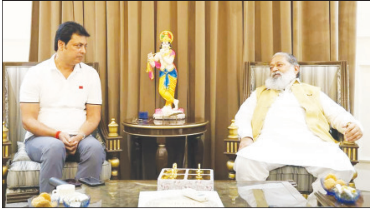
হরিমানা সরকারের প্রাক্তন স্বরাষ্ট্রমন্ত্রী এবং রাজ্যের বরিশত বিজেপি নেতা অনিল ভিঙ্গের সাথে দিল্লির বাসভবনে সৌজন্য সাক্ষাৎ মিলিত হন ত্রিপুরার প্রাক্তন মুখ্যমন্ত্রী বিপ্লব কুমার দেব।