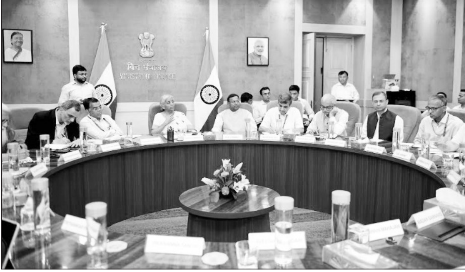
কেন্দ্রীয় অর্থ ও করপোর্ট বিষয়ক মন্ত্রী শ্রীমতি নির্মলা সীতারামন নয়াদিল্লিতে আসন্ন কেন্দ্রীয় বাজেট ২০২৪-২৫ এর জন্য পরামর্শ নিতে বিশিষ্ট অর্থনীতিবিদদের সাথে প্রথম প্রাক-বাজেট বৈঠকে সভাপতিত্ব করেন।