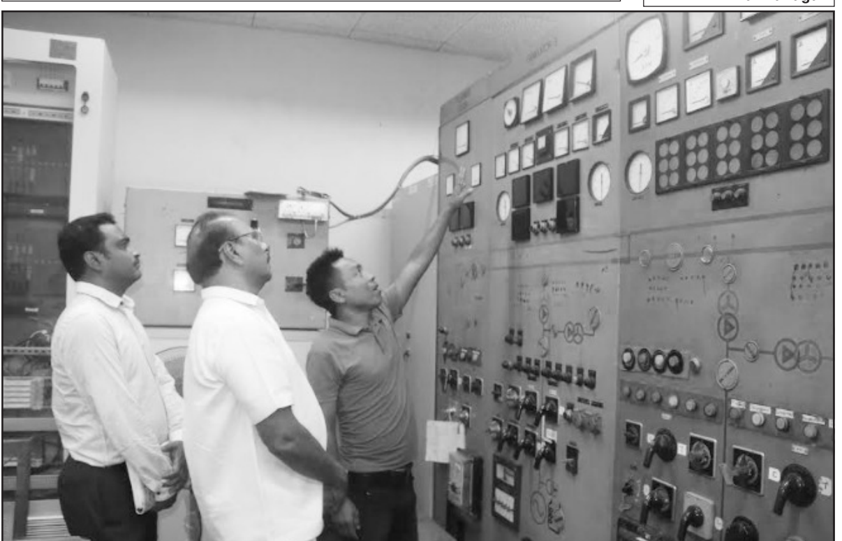
রাজপাল ইন্ড্রেনো রেড্ডি নাম্বু বুধবার ডুমুর হাইড্রো পাওয়ার প্রজেক্ট পরিদর্শন করেছেন।

ICA/C-330/24 For on behalf of the Governor of Tripura Executive Engineer Department of Agriculture & F.W Dharmanagar, North Tripura