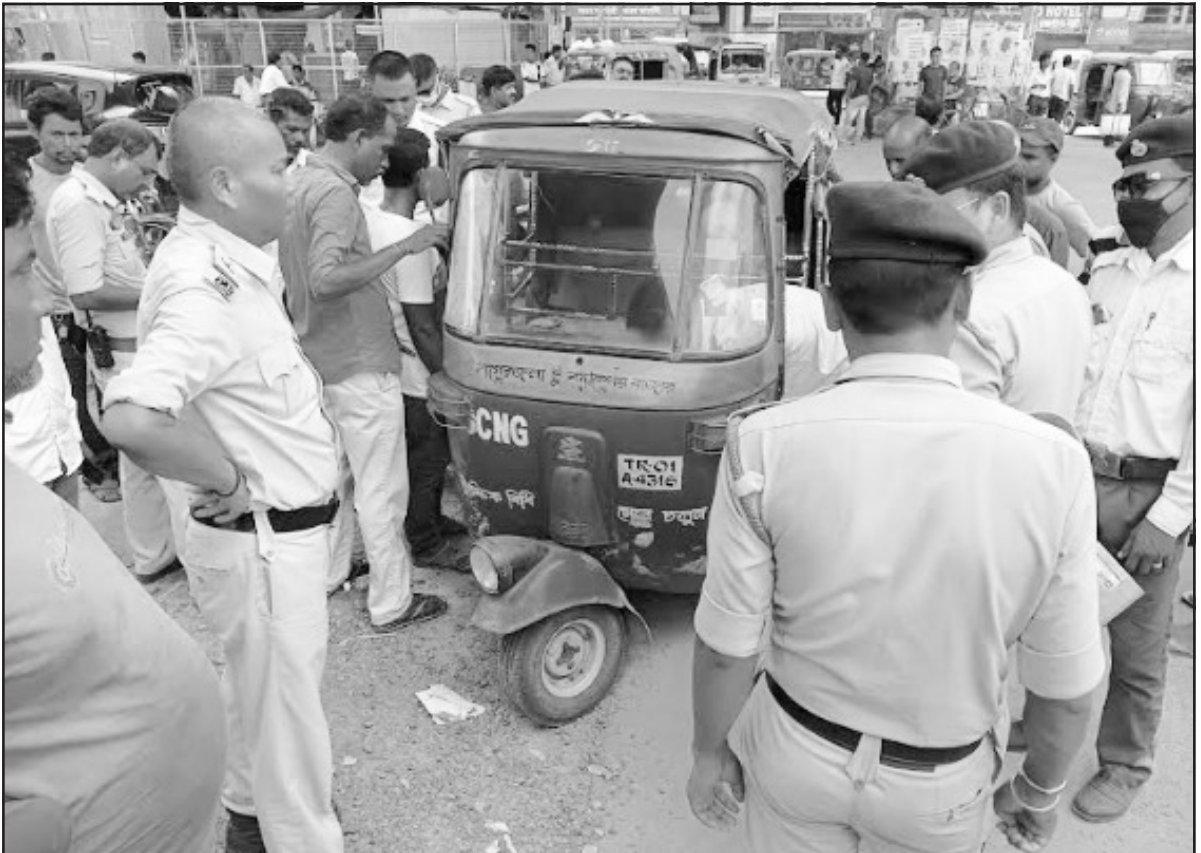
সোমবার আগরতলায় যত্রতত্র পার্কিং-র বিরুদ্ধে ট্রাফিক দফতরের অভিযান চলেছে।

মস্কো, ২৪ জুন (হি. স.): রাশিয়ার উত্তর ককেশাস অঞ্চলের দাগোস্তানের দুটি শহরে বন্দুকবাজদের হামলায় ৮ জন পুলিশ ও একজন ধর্মযাজক-সহ অন্তত ১৫ জন নিহত হয়েছেন। সেই সঙ্গে নিহত হয়েছেন ৬ জন সন্দেহভাজন বন্দুকবাজও। দাগোস্তানের গভর্নর সেগেই মেলিকভ এই তথ্য জানান। জানা গেছে, স্থানীয় সময় রবিবার সন্ধ্যায় দাগোস্তান অঞ্চলের দেববেস্ত ও মাখাচকাল শহরে ইফদিদের একটি উপাসনালয় (সিনাগগ), একটি অর্থোডক্স চার্চ ও পুলিশের একটি তদ্রাশিটোিকিতে হামলা চালায় বন্দুকবাজরা।