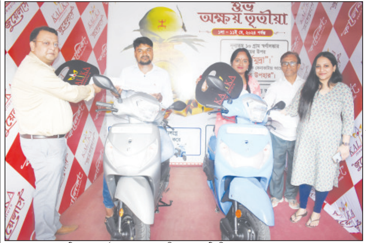
সোমবার আগরতলায় কালিকা জুয়েলার্সের পক্ষ থেকে অক্ষয় তৃতীয়া মেগা ড্র’র বিজয়ীদের পুরস্কার তুলে দেওয়া হয়েছে।

নিজস্ব প্রতিনিধি, আগরতলা, ২৪ জুন: ১১ দফা দাবি আদায়ের লক্ষ্যে রাজ্য পঞ্চায়েত অধিকর্তার নিকট ডেপুটেশন প্রদান করল সিআইটিইউ এর এক প্রতিনিধি দল। পানীয় জল সরবরাহ এবং কৃষি ক্ষেত্রে জল সেচের সঙ্গে যুক্ত পান্প অপারেটরদের দীর্ঘদিনের বিভিন্ন সমস্যা রয়েছে। তাদের খুবই করন অবস্থা। মজুরি ও একেবারেই কম। পাশাপাশি কোন ধরনের নোটিশ ছাড়াই তাদেরকে ছাটাই করে দেওয়া হয় প্রায়ই। যার ফলে একপ্রকার কর্মসংশয় নিয়ে ভুগছেন তারা। এই পরিপ্রেক্ষিতে এদিন রাজ্য পঞ্চায়েত অধিকর্তার নিকট ডেপুটেশন প্রদান করা হয়েছে।