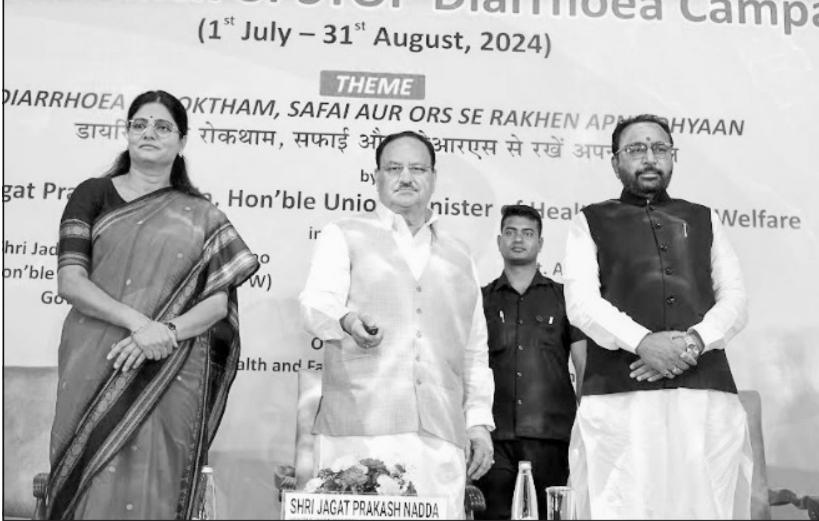
কেন্দ্রীয় স্বাস্থ্য ও পরিবার কল্যাণ এবং রাসায়নিক ও সার মন্ত্রী জগৎ প্রকাশ নাড্ডা সোমবার নয়া দিল্লিতে 'স্টপ ডায়রিয়া ক্যাম্পেইন ২০২৪' চালু করেছেন। স্বাস্থ্য ও পরিবার কল্যাণ এবং রাসায়নিক ও সার মন্ত্রকের প্রতিমন্ত্রী অনুপ্রিয়া প্যাটেল এবং আয়ুষ (স্বাধীন দায়িত্ব) এবং স্বাস্থ্য ও পরিবার কল্যাণ প্রতিমন্ত্রী যাদব প্রতাপরাও গনপতরাও উপস্থিত রয়েছেন।