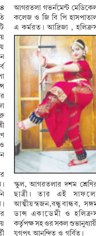
স্কুল, আগরতলার দশম শ্রেণির ছাত্রী। তার এই সাফল্যে আত্মীয় স্বজন, বন্ধু বান্ধব, সঙ্গম ডান্স একাডেমী ও হালিক্রস কর্তৃপক্ষ সহ ওর সকল গুণ্ডাখ্যায়ী যুগপৎ আনন্দিত ও গর্বিত।