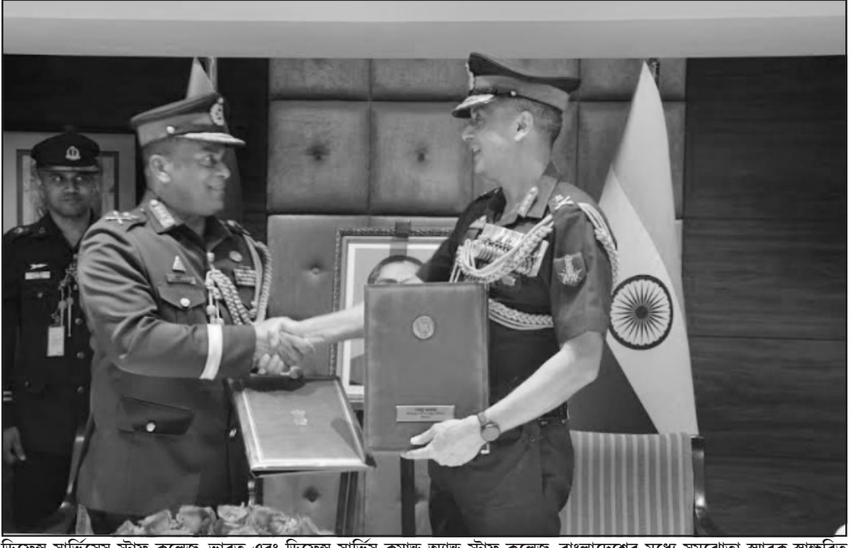
ডিফেন্স সার্ভিসেস স্টাফ কলেজ, ভারত এবং ডিফেন্স সার্ভিস কমান্ড অ্যান্ড স্টাফ কলেজ, বাংলাদেশের মধ্যে সমঝোতা স্মারক স্বাক্ষরিত হয়েছে।

চণ্ডীগড়, ২৪ জুন (হি. স.): চণ্ডীগড়ের একটি শপিং মলে উল্টে গেল টয়ট্রেন। টয়ট্রেন উল্টে যাওয়ার পরপরই সেখানে বছর ১১-র এক শিশুর মৃত্যু হয়। সোমবার পুলিশ সূত্রে জানা গেছে, চণ্ডীগড়ের একটি শপিং মলে টয়ট্রেন উল্টে গিয়ে ১১ বছরের এক শিশুর মৃত্যু হয়। ঘটনার সিসিটিভি ফুটেজ ইতিমধ্যেই সোশ্যাল মিডিয়ায় ভাইরাল হয়েছে। তাতে দেখা যাচ্ছে, চলতে চলতে ইউটার্ন নেওয়ার সময়ই টয়ট্রেনটি উল্টে যায়। তার জেরেই পাড়ে গিয়ে মাথায় আঘাত পায় ওই শিশুটি। তাকে হাসপাতালে নিয়ে গেলে চিকিৎসকরা মৃত ঘোষণা করে। পুলিশ ইতিমধ্যেই ওই টয়ট্রেন চালানোর অনুমতিতে নিষেধাজ্ঞা জারি করেছে এবং শপিং মলের টয়ট্রেন অপারেশনের বিরুদ্ধে মামলা দায়ের করা হয়েছে। অভিযুক্তকে গ্রেফতার করা হয়েছে বলেও জানিয়েছেন চণ্ডীগড়ের ডিএসপি রাম গোপাল।