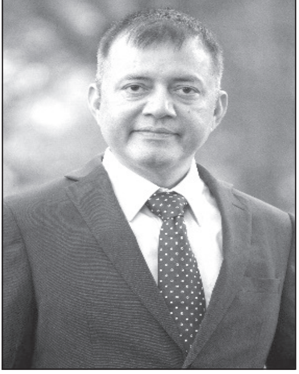
অধিকর্তা, আইআইএম ইন্দোর

রিফেল-টাইম জিপিএস ট্র্যাকিং নিয়োগ করা এবং ডিজিটাল গুণায়নমার্কার ব্যবহার করাও প্রফেসর রাইকে উল্লেখযোগ্যভাবে হ্রাস করতে পারে। এআই-চালিত প্রক্টরিং সিস্টেম নিয়োগ করা পরীক্ষার পর্যবেক্ষণ ব্যবস্থাকে বাড়িয়ে তুলতে পারে, প্রতারণার সম্ভাবনা হ্রাস করতে পারে। যে প্রার্থীর আরও বেশি নম্বরের দাবি করে তাদের জন্য বায়োমেট্রিক ভেরিফিকেশন ব্যবস্থা চালু করে আরও একটি সুরক্ষা ব্যবস্থাকে যুক্ত করা যেতে পারে। উপরন্তু, অধীন সংস্থাগুলি কর্তৃক ঘন ঘন, পুষ্কানুপুষ্ক নিরীক্ষা পরিচালনা করা পরীক্ষা প্রক্রিয়ার মধ্যে দুর্বলতাগুলি সনাক্ত করতে সহায়তা করতে পারে। স্বচ্ছ এবং নিয়মিত পর্যালোচনাগুলি নিশ্চিত করবে যে সুরক্ষা প্রোটোকলগুলি মেনে চলা হচ্ছে এবং কোনও বৈষম্যের দ্রুত সমাধান করা হচ্ছে। ভবিষ্যতে ডিজিটাল লকের ব্যর্থতা ঠেকাতে পরীক্ষার ব্লকলেট বাস্তু ম্যানুয়ালি খোলা এবং প্রশ্নপত্র বিতরণে বিঘ্ন সোধ করতে কঠোর রক্ষাবেশের সমন্বয় এবং ব্যাকআপ প্রোটোকল বাস্তবায়ন করতে হবে। নিয়মিত রক্ষাবেশেণ ব্যবস্থাগুলি পরীক্ষার আগে ডিজিটাল লকগুলি পরীক্ষার কার্যকর রয়েছে কিনা তা নিশ্চিত করা উচিত। এছাড়া, কঠোর তত্ত্বাবধানে সুরক্ষিত ম্যানুয়াল ওভাররাইডগুলির জন্য জরুরি পদ্ধতিতে প্রশিক্ষণ দেওয়া উচিত। এই পদক্ষেপগুলি বিশ্ব হ্রাস করতে এবং পরীক্ষার অখণ্ডতা বজায় রাখতে সহায়তা করবে। শিক্ষার্থী, পিতামাতা, শিক্ষাবিদ এবং নীতিনির্ধারণকর্তাদের নিয়োগিতা এবং সততার গুণাবলীর উপর জোর প্রদান