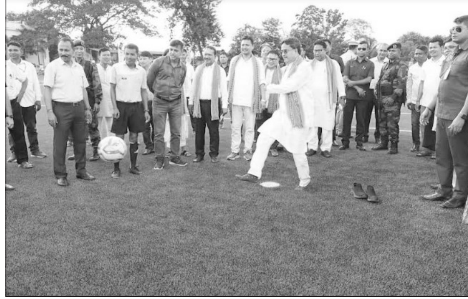
রাজ্য যুব ও ক্রীড়া দপ্তরের ব্যবস্থাপনায় "খেলা ইন্ডিয়া" প্রকল্পের অধীনে প্রায় ৫ কোটি বায়ে নির্মিত হলো সুখ্য দেববর্মা মোরোরিয়াল হায়ার সেকেন্ডারী স্কুল এর সিঙ্গেলটিক ফুটবল টার্ক মাঠ। মঙ্গলবার শুভ উদ্বোধন করেন মুখ্যমন্ত্রী প্রফেসর ডাঃ মানিক সাহা।