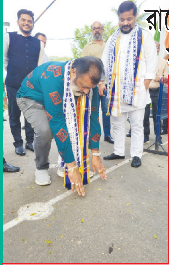
নিজস্ব প্রতিনিধি, আগরতলা, ৯ জুলাই। ধর্মীয় পর্যটন, আ্যাডভেঞ্চার টুরিজমের উপর কেন্দ্রীয় সরকার বিশেষভাবে গুরুত্ব দিয়েছে। এই দুটি ক্ষেত্রে নানা প্রকল্প নিয়ে কেন্দ্রের বর্তমান সরকার কাজ করছে। রাজ্যগুলিকেও এই দৃষ্টিভঙ্গিতে কাজ করতে হবে। আজ বিকেলে

রাজ্য অতিথিশালায় ত্রিপুরার পর্যটন নিয়ে আয়োজিত এক পর্যালোচনা সভায় কেন্দ্রীয় পেট্রোলিয়াম, প্রাকৃতিক গ্যাস ও পর্যটন প্রতিমন্ত্রী সুরেশ গোপী একথা বলেন। তিনি বলেন, ত্রিপুরায় পর্যটন শিল্পের বিকাশের প্রভূত সম্ভাবনা রয়েছে। এ ব্যাপারে প্রকৃত পেশাদারি মনোভাব নিয়ে চলতে হবে। পর্যটন শিল্পের মাধ্যমে বেকার যুবক যুবতীদের কর্মসংস্থানের বিরাট সুযোগ রয়েছে। পর্যটনের মাধ্যমে স্বরোজগারী হওয়ার জন্য বেকারদের উদ্বুদ্ধ করতে হবে। এ ব্যাপারে মুদ্রা লেন একটি বড় ভূমিকা নিতে পারে। নবপ্রজন্ম এগিয়ে এলে শুধু তারাই স্বাবলম্বী হবে না ত্রিপুরাও এর মাধ্যমে লাভবান হবে। পর্যটন শিল্পের বিকাশে অন্য রাজ্যগুলির সঙ্গে প্রতিযোগিতার মনোভাব নিয়ে এগিয়ে আসার আহ্বান জানিয়ে কেন্দ্রীয় প্রতিমন্ত্রী সেক্টরের থেকে মাঠ পর্যন্ত সময়েই কার্যকরভাবে ব্যবহার করার উপর পরামর্শ দিয়েছেন।