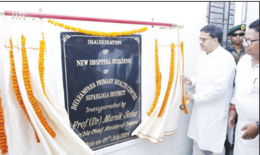
ফুটবল টার্নের। এই ৩ প্রকল্পের একযোগে উদ্বোধনী অনুষ্ঠান হয় জম্পুইজলা সুধনা দেববর্মী এইচ.এস স্কুল মাঠে। সেখানে মুখ্যমন্ত্রী ভাষণ রাখতে গিয়ে আরো বলেন জম্পুইজলা এলাকার উন্নয়নে প্রায় ১৪০০ কোটি টাকা বিশ্ব ব্যাঙ্ক থেকে ঋণ নিয়েছে রাজ্য সরকার। তা দিয়ে উল্লেখিত এলাকার রাস্তাঘাট

নিজস্ব প্রতিনিধি, চড়িলাম, ৯ জুলাই।। রক্তের যেমন কোন ধর্ম হয়না। তেমনি উন্নয়নের কোন ধর্ম হয়না। এই ভাবনা থেকেই বর্তমান রাজ্য সরকার জাতি-ধর্ম নির্বিশেষে সকলের সার্বিক উন্নয়নে কাজ করে চলেছে। দেশের প্রধানমন্ত্রী নরেন্দ্র মোদী সাহেব, সবকা বিকাশ, বিশ্বাস ও সবকা প্রয়াসের স্লোগান আক্ষরিক অর্থেই বর্তমান রাজ্য সরকার পালন করছে। আজ সিপাহীজলা জেলার জম্পুইজলা মহকুমায় ৩ টি সরকারি প্রকল্পের উদ্বোধন করে একথা বলেছেন রাজ্যের মুখ্যমন্ত্রী উত্তর মালিক সাহা। প্রথমেই মুখ্যমন্ত্রী জম্পুইজলার গোলাঘাট এলাকার দয়ারামপাড়ায় উদ্বোধন করেন দয়ারামপাড়া প্রাথমিক স্বাস্থ্য কেন্দ্রের নবনির্মিত ভবনের। এর পর মুখ্যমন্ত্রীর হাত ধরে উদ্বোধন হয় টাকারাজালা সামাজিক স্বাস্থ্য কেন্দ্রের নতুন ভবন। সর্বশেষ মুখ্যমন্ত্রীর হাত ধরে উদ্বোধন হয় সুধনা দেববর্মী এইচ.এস স্কুল সংলগ্ন সিনেথেকি