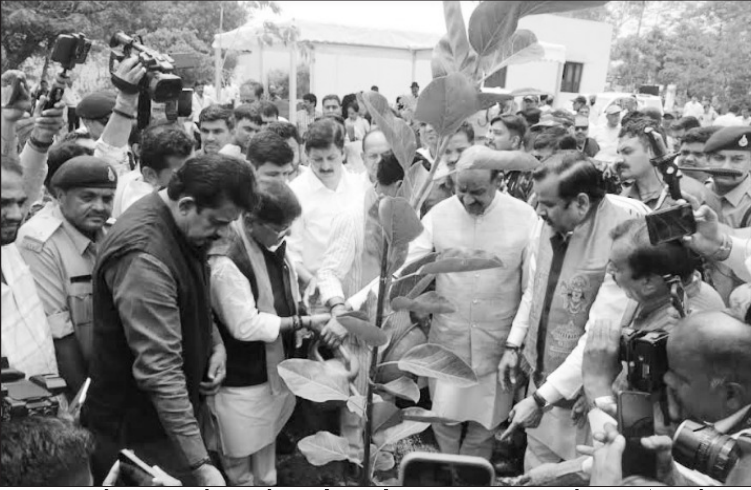
লোকসভার অধ্যক্ষ ওম বিড়লা মধ্যপ্রদেশে একদিনের সফরে গিয়ে প্রধানমন্ত্রী নরেন্দ্র মোদীর 'এক পেড় মা কে নাম' প্রচারণার অংশ হিসাবে মঙ্গলবার ইন্দোরের বিজ্ঞান বন শিবির প্লান্টেশন সাইটে একটি চারা রোপণ করেছেন।