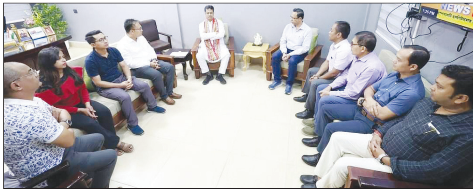
রাজ্যে সফল ভাবে কিডনি প্রতিস্থাপন সম্পন্ন হওয়ায় এই অপারেশনের সাথে সংযুক্ত মেডিকেল টিম মুখ্যমন্ত্রীর সরকারি বাসভবনে যান। তাদের সঙ্গে দেখা করে তাদের উন্নয়ন আশ্রয়না জানান মুখ্যমন্ত্রী প্রফেসর ডা. মানিক সাহা।