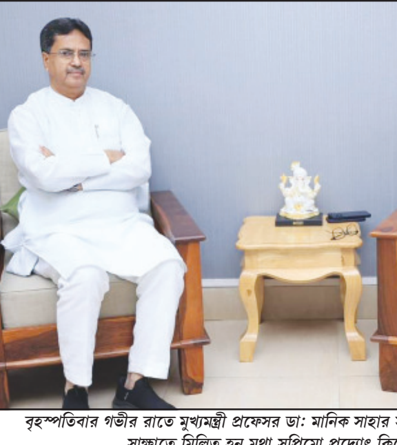
বৃহস্পতিবার গভীর রাতে মুখ্যমন্ত্রী প্রফেসর ডাঃ মানিক সাহা সরকারি বাসভবনে এক সৌজন্য সাক্ষাতে মিলিত হন মধ্য সুগ্রীমো প্রদোৎ কিশোর দেববর্মা।