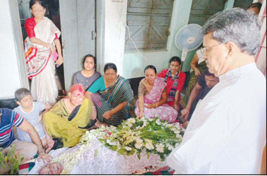
পারিবারিক সম্পর্ক ছিল বলেও নিবেদন করে প্রয়াতের মর্ম বেদনা এবং প্রয়াতের আত্মার জানান তিনি। এদিন শেষ শ্রদ্ধা পরিবার-পরিজনদের প্রতি গভীর চিন্তাশক্তি ৩৬ এর পাতায় দেখুন