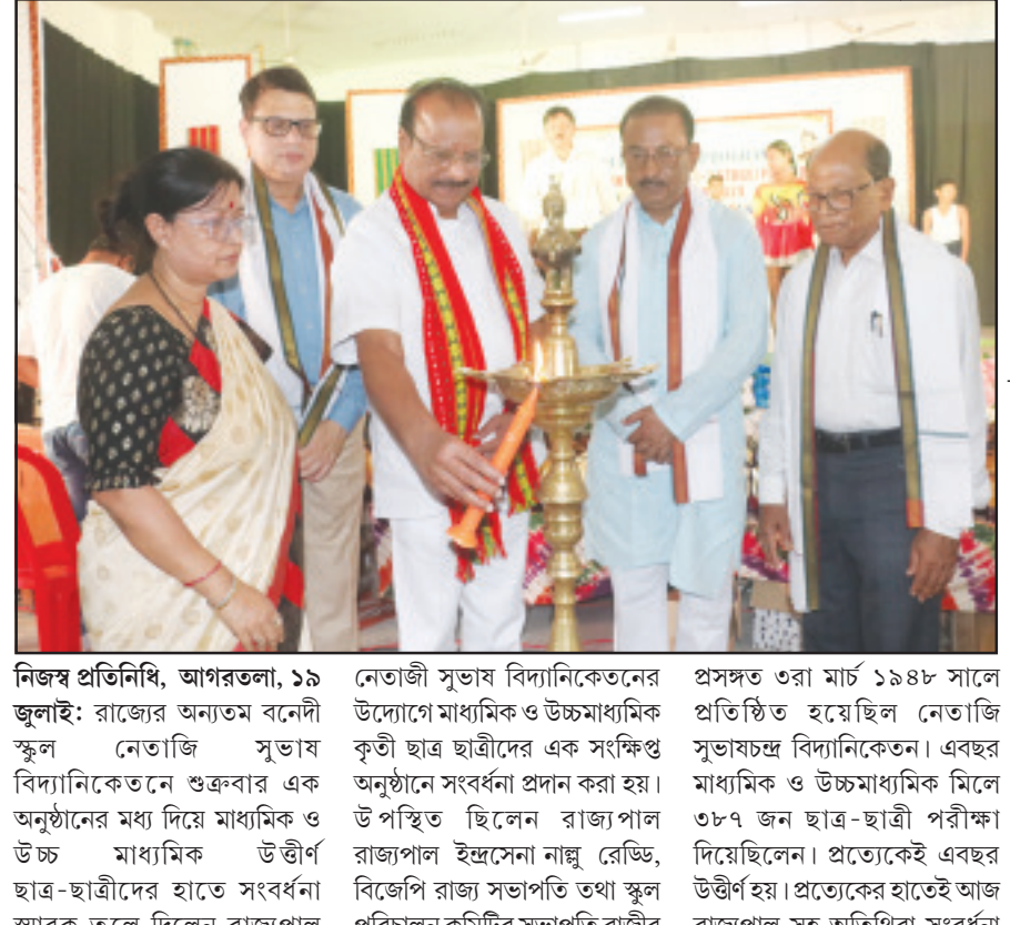
নেতাজি সুভাষ বিদ্যালিকেতনের উদ্যোগে মাধ্যমিক ও উচ্চমাধ্যমিক কুর্চী ছাত্র ছাত্রীদের এক সংক্ষিপ্ত অনুষ্ঠানে সংবর্ধনা প্রদান করা হয়।