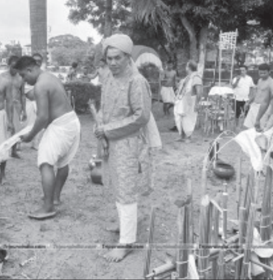
তাদের বাড়ি সাজায়। আর শ্রদ্ধা জ্ঞাপনের উৎসব আনন্দোৎসব বা বহু শতাব্দী কাল পূজাঙ্গল থেকে প্রজ্জ্বলিত বলেও গণ্য করা হয়। খার্চি ধরে চলে আসছে।

আওনের অংশ তাদের বাড়িতে নিয়ে যায় এই বিশ্বাসে যে এই পবিত্র অগ্নি অশুভ শক্তি দূর করবে এবং তাদের মঙ্গল সুনিশ্চিত করবে। এখানে উল্লেখযোগ্য যে কৃষিপ্রধান ত্রিপুরায় মানুষ মা বসুন্ধরা ও প্রকৃতির উপর নির্ভরশীল। তাই কের পূজাকে বসুন্ধরা ও প্রকৃতির