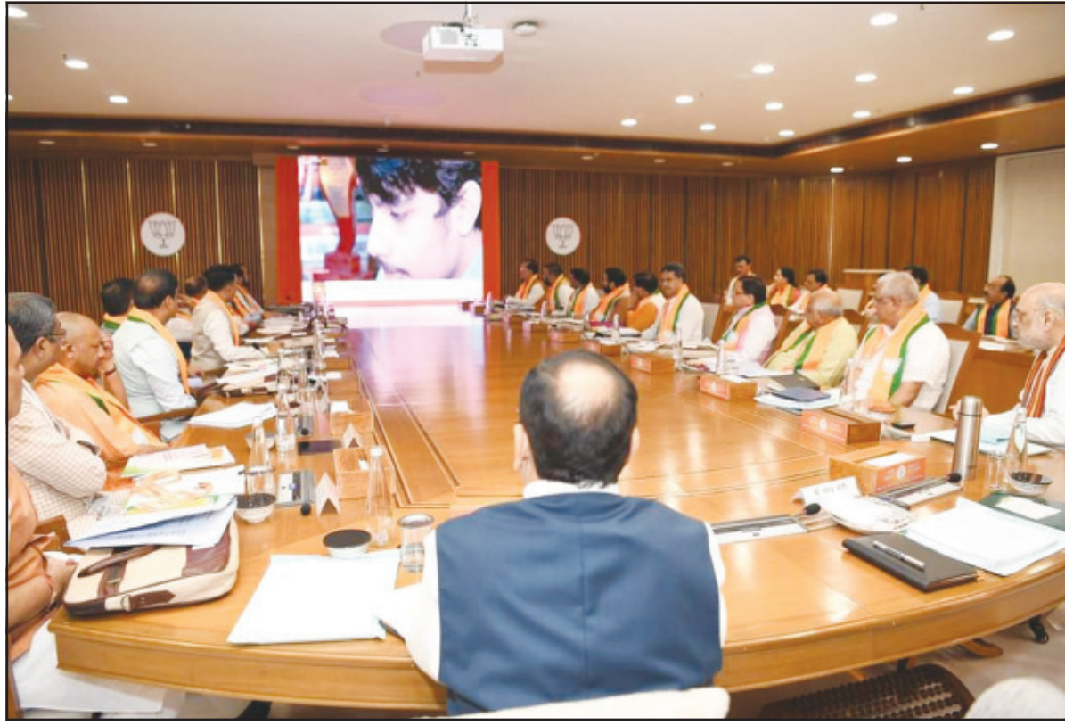
রবিবার প্রধানমন্ত্রীর মন কি বাত এর ১১২ তম পর্বে জেপি নাড্ডার উপস্থিত অনুষ্ঠানে অনুষ্ঠানটি শ্রবণ করেন মুখ্যমন্ত্রী ডাঃ মানিক সাহা সহ অন্যান্যরা।