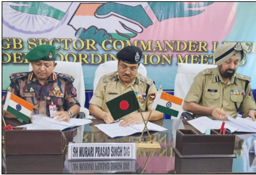
আন্তঃসীমান্ত অপরাধ ঠেকাতে বহুমুখী কৌশল গ্রহণ করেছে বিএসএফের।

নিজস্ব প্রতিনিধি, আগরতলা, ৩১ জুলাই। বিএসএফ ত্রিপুরা আন্তঃসীমান্ত অপরাধ এবং অবৈধ অনুপ্রবেশ ঠেকাতে বহুমুখী কৌশল গ্রহণ করেছে। বিশেষ করে পাচার বাণিজ্য ও অনুপ্রবেশের জন্য কৃষি পূর্ণ অঞ্চলে সীমান্ত সেনা বাড়ানো হয়েছে। নজরদারি জোরদার করা হয়েছে এবং অত্যাধুনিক পরিষেবা এবং ড্রোন অন্তর্ভুক্ত করা হয়েছে।