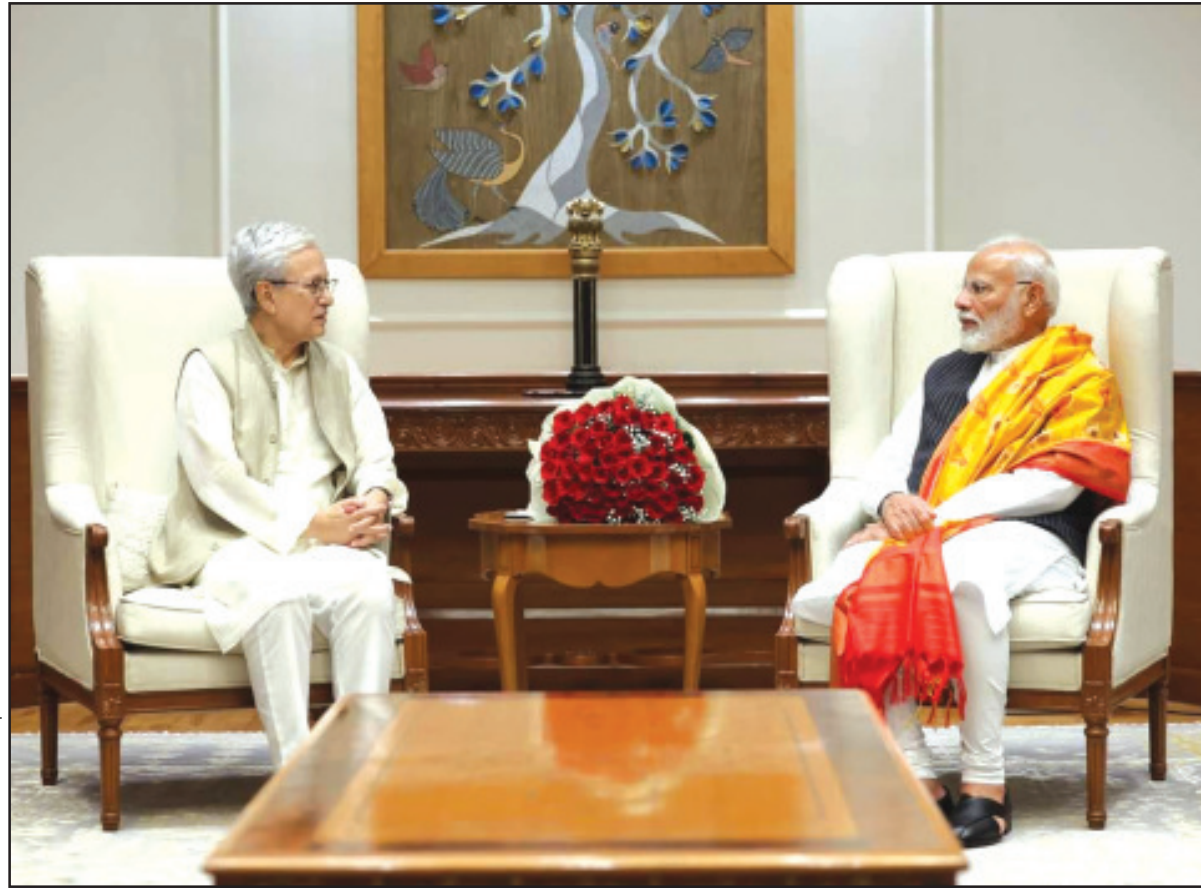
ত্রিপুরা থেকে প্রথম তেলঙ্গানা রাজ্যপাল হিসাবে নিযুক্তি পাওয়ার পর শনিবার রাজ্যপাল যীশু দেবর্মা প্রধানমন্ত্রী নরেন্দ্র মোদীর সাথে এক সৌজন্য সাক্ষাতে মিলিত হন।