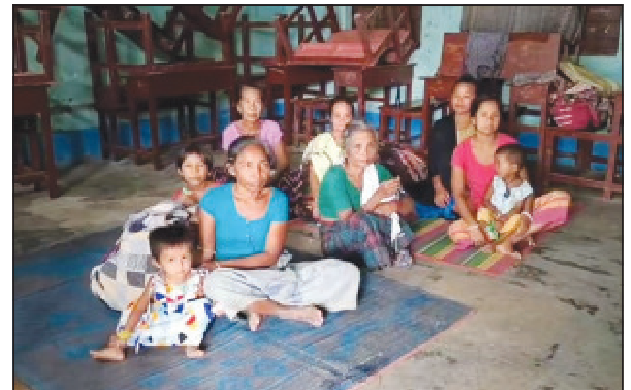
রাজ্যে টানা বর্ষণে শরণার্থী ক্যাম্পে ঠাই নিয়েছে রাজ্যের বহু মানুষ। শনিবারের তোলা ছবি।

নিজস্ব প্রতিনিধি, আগরতলা, ৩ আগস্ট । ত্রিপুরায় টানা দুইদিনের বৃষ্টিপাতে রাজ্যের একাধিক জায়গায় ব্যাপক ক্ষতিগ্রস্ত হয়েছে। কিন্তু হতাহতের কোনো খবর নেই। রাজ্য জুড়ে ১টি বাড়ি সম্পূর্ণ, ৩৭টি বাড়ি মারাত্মকভাবে এবং ৮২টি বাড়ি আংশিকভাবে ক্ষতিগ্রস্ত হয়েছে। প্রশাসনের তরফে ক্ষতিপূরণের সমীক্ষা করা হচ্ছে। রাজ্য দুর্ভোগ মোকাবিলা দফতরের রিপোর্টে এমনটাই তথ্য পাওয়া গিয়েছে।