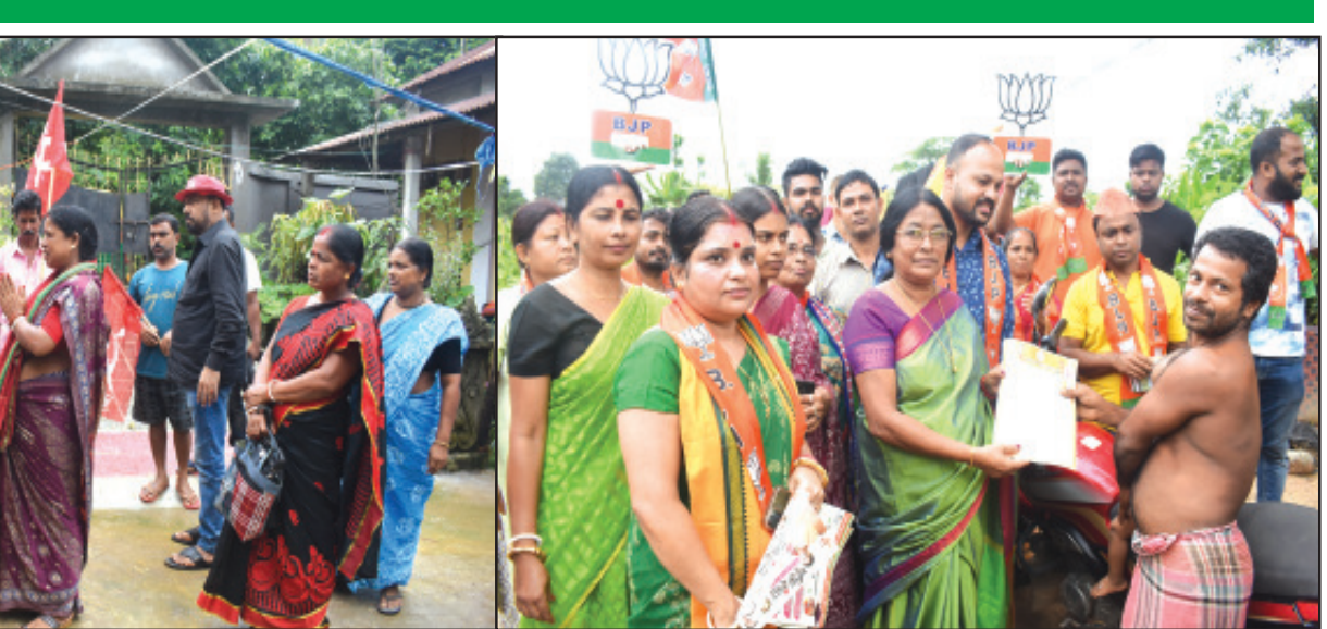
হাতে গোনা ত্রিপুরা পঞ্চায়েত নির্বাচনে। এই নির্বাচনকে সামনে রেখে শনিবার ডান-বাম উভয় শিবিরে পরিচালিত হলো জোরদার প্রচারের চিত্র।

আগরতলা, ৩ আগস্ট: পশ্চিম ত্রিপুরা জেলা পরিষদের ১৭ নং ওয়ার্ডে ভোট প্রচার জমে উঠেছে। বিজেপি ও সিপিআইএম প্রার্থী কোমর ধোঁধে ময়দানে নেমেছেন। জয় নিয়ে উভয় প্রার্থীই আশাবাদী। তবে ভাগ্য নির্ধারণ করবেন গণদেবতারা।