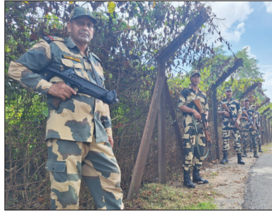
উত্তর বাংলাদেশ, ইন্দো - বাংলা সীমান্তে কড়া নজরদারী জওয়ানদের

কর্মসূচী কমলপুর মহকুমার বিভিন্ন প্রান্তে সংগঠিত হয়েছে।