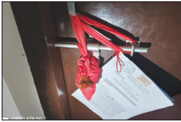
লিমিটেড কোম্পানির তরফে ২০২০ সালে আদালতে একটি মামলা করে। এই জায়গাটির মূল্য ছিল ৫ কোটি টাকার অধিক। দীর্ঘদিন মামলাটি চলার পর জুলাই মাসের ৩০ তারিখ আদালতের এডিশনাল ডিস্ট্রিক্ট জর্জ উক্ত মামলার রায় ঘোষণা করেন। আদালতের নির্দেশে সোমবার বিকলে সিপাহীজলা জেলাশাসকের অফিসে মালিকপক্ষের লোকজন ও উক্ত মামলায় নিয়োজিত উকিল বাবুরা এসে অতিরিক্ত জেলা শাসকের আওতাধীন জমি অধিগ্রহণ সংগৃহীত অফিসটি সিল করে দেন।

নিজস্ব প্রতিনিধি, চট্টগ্রাম, ১২ আগস্ট। জমি অধিগ্রহণের টাকা না মিটিয়ে দেওয়ায় সিপাহীজলা অতিরিক্ত জেলা শাসকের আওতাধীন জমি অধিগ্রহণ সংগৃহীত অফিস সিল করে দেওয়া হয়েছে। সিপাহীজলা জেলা শাসকের কার্যালয়টি জেলা সদর বিশ্রামগঞ্জে অবস্থিত। আদালতের নির্দেশে অফিস সিল করে দেওয়ার ঘটনায় ব্যাপক আলোড়ন ও ছিঃ ছিঃ রব উঠেছে সাধারণ মানুষের মধ্যে। ঘটনার বিবরণে জানা যায় এই সিপাহীজলা ডিএম অফিসটি যে জমির উপর নির্মিত হয়েছে সেই জমির মালিককে জমির মূল্য ৫ কোটি টাকা এখানে দেওয়া হয় নি। জানা যায়, বর্তমানে যে জায়গায় সিপাহীজলা জেলার ডিএম অফিসটি অবস্থিত সেই জায়গার প্রকৃত মালিক অনিল প্লেস্টেশন প্রাইভেট লিমিটেড নামে একটি কোম্পানি। জমির মূল্য না পেয়ে অনিল প্লেস্টেশন প্রাইভেট লিমিটেড কোম্পানির তরফে ২০২০ সালে আদালতে একটি মামলা করে। এই জায়গাটির মূল্য ছিল ৫ কোটি টাকার অধিক। দীর্ঘদিন মামলাটি চলার পর জুলাই মাসের ৩০ তারিখ আদালতের এডিশনাল ডিস্ট্রিক্ট জর্জ উক্ত মামলার রায় ঘোষণা করেন। আদালতের নির্দেশে সোমবার বিকলে সিপাহীজলা জেলাশাসকের অফিসে মালিকপক্ষের লোকজন ও উক্ত মামলায় নিয়োজিত উকিল বাবুরা এসে অতিরিক্ত জেলা শাসকের আওতাধীন জমি অধিগ্রহণ সংগৃহীত অফিসটি সিল করে দেন। যতদিন না পর্যন্ত প্রকৃত মালিক জায়গার সঠিক মূল্য পাচ্ছেন ততদিন পর্যন্ত কার্যালয়ে অনির্দিষ্টকালের জন্য তালা থাকবে বলে জানান কোম্পানির নিয়োজিত আইনজীবীরা। জেলার সর্বোচ্চ সরকারি কার্যালয়ের জমি অধিগ্রহণ সংগৃহীত অফিসটি সিল করা হয়েছে যেটা শুনে হতবাক সাধারণ মানুষ।