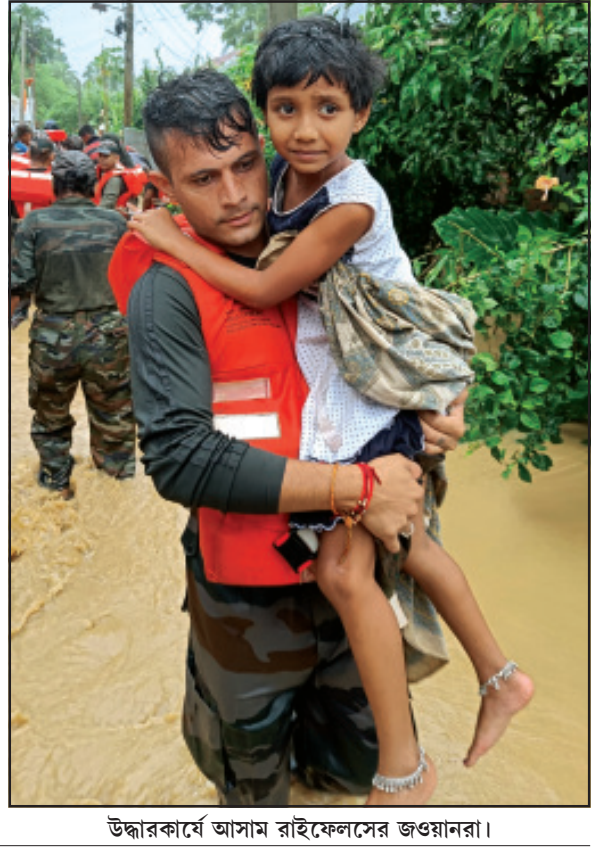
উদ্ধারকার্যে আসাম রাইফেলসের জওয়ানরা।

নিজস্ব প্রতিনিধি, আগরতলা, ২১ আগস্ট। গোমতী নদীর জল চরম বিপদ স্তর অতিক্রম করেছে। নিরাপদ স্থানে সরিয়ে নিয়ে যাওয়া হয়েছে। রাজ্যের সংকট পরিস্থিতিতে বিএসএফের সাহায্যকে সাধুবাদ জানিয়েছেন প্রত্যেকেই।