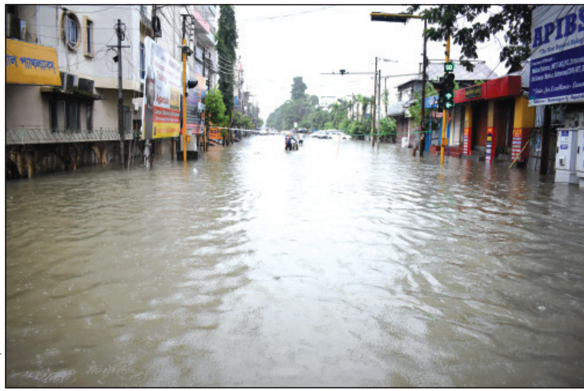
অবিরাম বর্ষণে আগরতলায় রাজপথ বৃষ্টির জলে টইটুয়র।