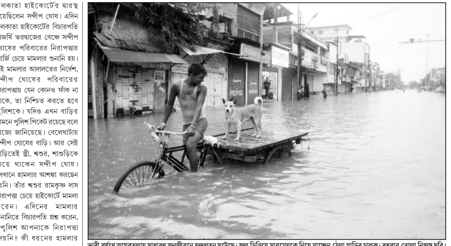
ভারী বর্ষাে আগরতলায় সাধারণ জনজীবনে ছুদপতন ঘটেছে। জল ডিঙিয়ে সারমেয়কে নিয়ে যাচ্ছেন টেনা গাড়ির চালক। বৃহবার তোলা নিজস্ব ছবি।