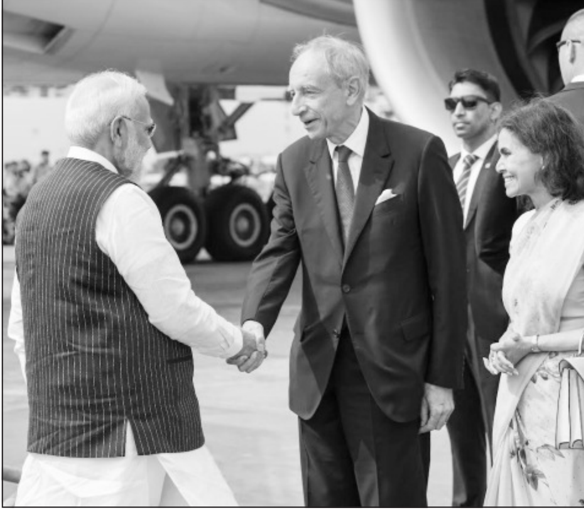
বৃহবার পোলায়ত পৌছেছেন প্রধানমন্ত্রী নরেন্দ্র মোদী। ওয়ারস মিলিটারি বিমানবন্দরে তাঁকে স্বাগত জানানো হচ্ছে।