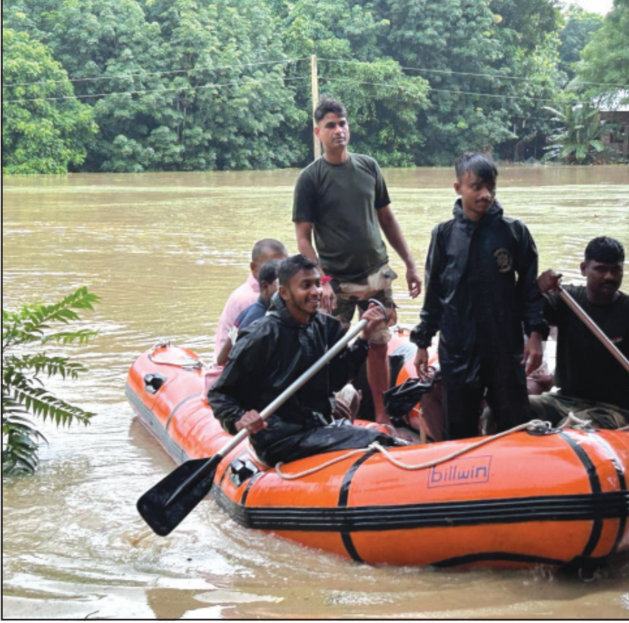
উদ্ধারকার্যে বিএসএফ জওয়ানরা।

গতকালের পর আজ সকালের দিকে বিশালগড়ের রাউৎখলা পূর্ব লক্ষ্মীবিল প্রভৃতি এলাকায় জল কিছুটা নামতে শুরু করেছিলো। ফের বৃষ্টি শুরু হওয়ায় পরিস্থিতি আবার অবনতি হয়। বরং কসবা সহ বিশালগড়ের বেশ কয়েকটি এলাকা নতুন করে প্রাণিত হয়েছে।