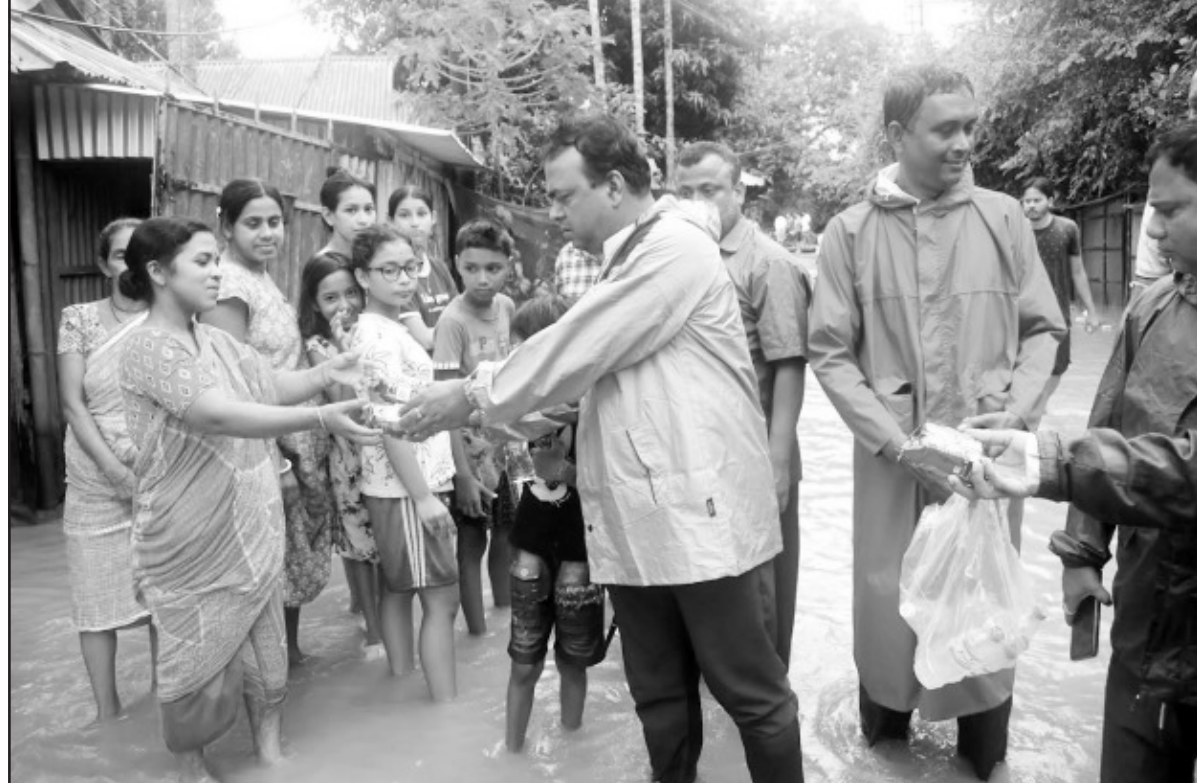
আগরতলা পুর নিগমের কর্পোরটর অতিথি মল্লিক বন্যায় বিধ্বস্ত পরিবারের হাতে ত্রাণ সামগ্রী তুলে দিচ্ছেন।

খারিজ করে দেওয়ার চেষ্টা করেন।” প্রসঙ্গত, এদিন ই এম বাইপাস সংলগ্ন আনন্দপুরের নোনাডাঙায় জনবহুল এলাকায় রাস্তার পাশ থেকে উদ্ধার হয়ে এক যুবতীর ক্ষতবিক্ষত দেহ। এলাকারই এক বাসিন্দা দাবি করেছেন, ভোর পাঁচটা নাগাদ ওই জায়গা দিয়ে যাওয়ার সময় তিনি কোনও দেহ দেখতে পাননি। সম্ভবত তার পরেই দেহ ফেলে যাওয়া হয়।