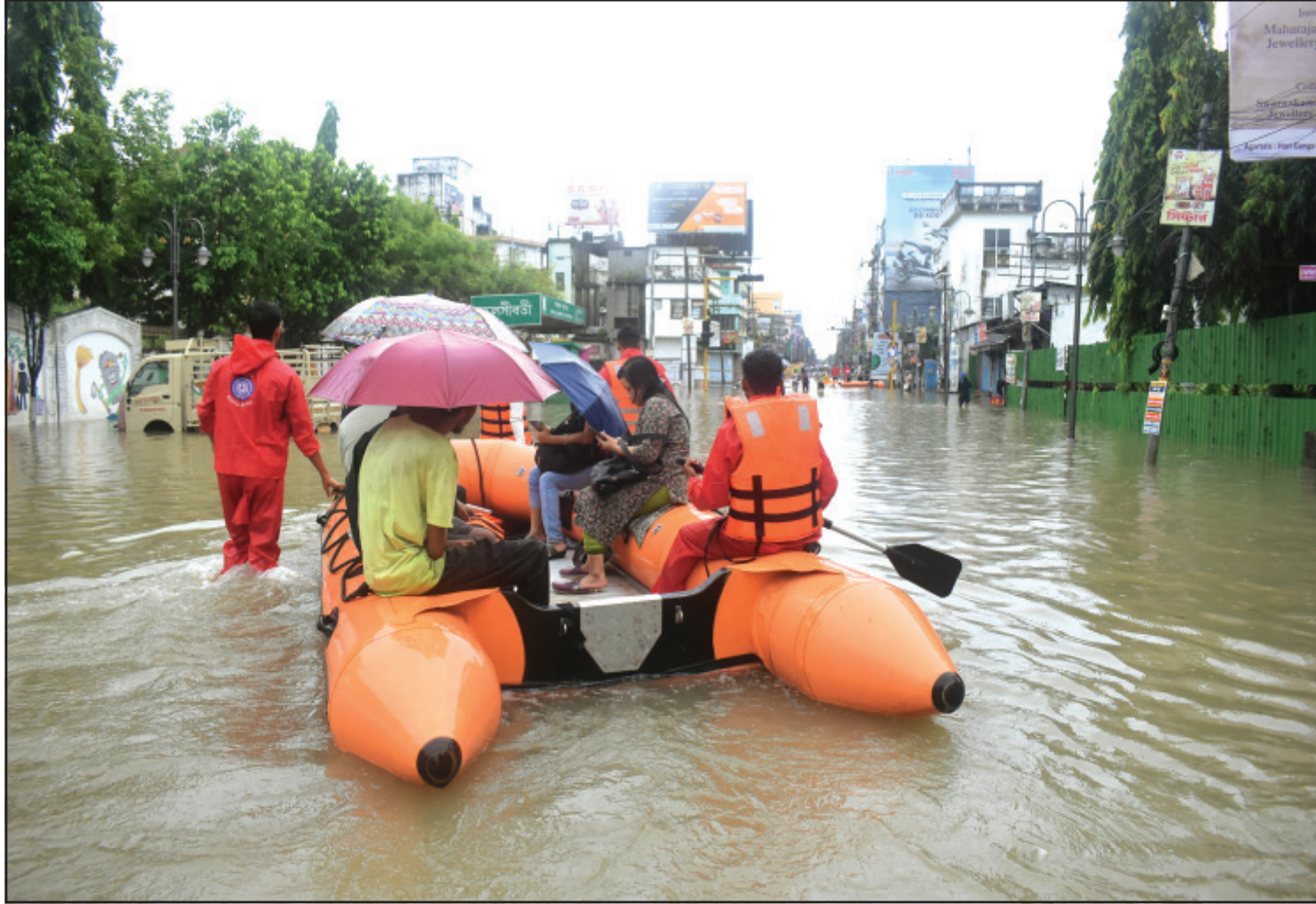
অবিরাম বর্ষণে জলমগ্ন হয়ে পরেছে আগরতলা। বুধবার শহরবাসীকে উদ্ধার করা হচ্ছে।

গত ২৪ ঘণ্টায় পশ্চিম ত্রিপুরা জেলায় ১৮২ মিমি, খোয়াই জেলায় ১৫৭.৩০ মিমি ও গোমতী জেলায় ১৫৩.১০ মিমি বৃষ্টিপাত হয়েছে। এতে রাজ্যের বিভিন্ন এলাকায় বন্যার ফলে ব্যাপক ক্ষয়ক্ষতি হয়েছে। বিশেষ করে গোমতী ও উনকোটি জেলা বেশী ক্ষতিগ্রস্ত হয়েছে।