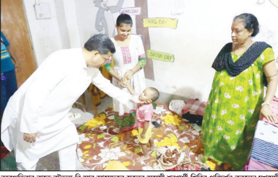
বৃহস্পতিবার রাতে বটতলা বি আর আবেদকর স্কুলের অস্থায়ী শরণার্থী শিবির পরিদর্শন করলেন মুখ্যমন্ত্রী

পাশাপাশি, মেলারমাথ ফ্লাই-ওভার থেকে প্যারাডাইস, প্যারাডাইস চৌমুহনী থেকে পোস্ট অফিস, মহিলা কলেজ থেকে গণরাজ চৌমুহনী, গণরাজ চৌমুহনী থেকে পুরাতন মোটর স্ট্যান্ড, নাগেরজলা থেকে বটতলা, ওরিয়েন্ট চৌমুহনী থেকে সূর্য চৌমুহনী, ওরিয়েন্ট চৌমুহনী থেকে আরএমএস চৌমুহনী; ওরিয়েন্ট চৌমুহনী থেকে রবীন্দ্র ভবন ক্রসিং; নেতাজি চৌমুহনী থেকে পোস্ট অফিস চৌমুহনী রাস্তা জলমগ্ন। তাই যাত্রীদের বিকল্প পথ দিয়ে যাতায়াত করার জন্য অনুরোধ জানিয়েছে ট্রাফিক দপ্তর। অন্যদিকে, অপরপুর বন্যা কবলিত এলাকায় উদ্ধার কাজ ত্বরান্বিত করার জন্য এমআই-৭ হেলিকপ্টার মোতায়েন করা হয়েছে। আজ সামাজিক মাধ্যমে এমআই-৭ বার্তা দিলেন মুখ্যমন্ত্রী অধ্যাপক (ডা.) মানিক সাহা। মুখ্যমন্ত্রী বলেন, অপরপুরে ভয়াবহ বন্যা পরিস্থিতি সৃষ্টি হয়েছে। এ বিষয়ে স্বরাষ্ট্র মন্ত্রী অমিত শাহের সাথে কথা হয়েছে। ইতিমধ্যে রাজ্যে এনডিআরএফ-১৭ টিম পৌঁছে গিয়েছে। তাছাড়া, বন্যা কবলিত এলাকা থেকে হেলিকপ্টারের মাধ্যমে উদ্ধার কাজ চালানো শুরু হয়েছে। ইতিমধ্যে উদ্ধার কাজে হাত লাগাতে আরও একটি এম আই ১৭ হেলিকপ্টার আগরতলা এমবিবি বিমানবন্দরে অবতরণ করেছে।