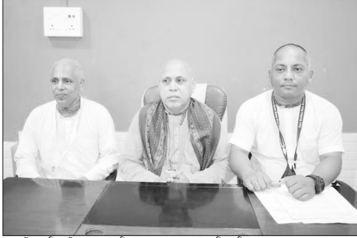
শুক্রবার ইসকন মন্দিরের উদ্যোগে এক সাংবাদিক সম্মেলনের আয়োজন করা হয়।