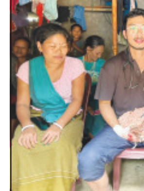
প্রাথমিক স্বাস্থ্যকেন্দ্রের ভারপ্রাপ্ত চিকিৎসক দ্রুত একটি মেডিকেল টিম গঠিত করে গর্ভবতী মহিলার বাড়িতে পাঠানোর ব্যবস্থা করেন।

নিজস্ব প্রতিনিধি, আগরতলা, ২৩ আগস্ট। ঝড় বৃষ্টি এবং বন্যা পরিস্থিতিতেও স্বাস্থ্যকর্মীরা প্রতিনিয়ত দুর্গম ও প্রত্যন্ত অঞ্চলে নিয়মিত স্বাস্থ্য পরিষেবা প্রদান করছেন। গতকাল (২২ আগস্ট, ২০২৪) সকাল সাড়ে সাটটা নাগাদ দলপতি প্রাথমিক স্বাস্থ্যকেন্দ্রের স্বাস্থ্যকর্মীদের কাছে খবর আসে রতননগর আয়ুর্মান আরোগ্য মন্দির এলাকার থানি পাড়ার প্রত্যন্ত এলাকার ২০ বছর বয়স্ক এক গর্ভবতী মহিলা প্রসব বেন্দরায় কষ্ট পাচ্ছেন। কিন্তু প্রত্যন্ত অঞ্চলের এলাকাটি ছিল খুবই দুর্গম। ভারী বৃষ্টিপাতের ফলে ভূমিধস ও বন্যা পরিস্থিতিতে গর্ভবতী-মাকে পরিবারের লোকজন হাসপাতালে আনতে পারছিলেন না। এই খবরের ভিত্তিতে দলপতি