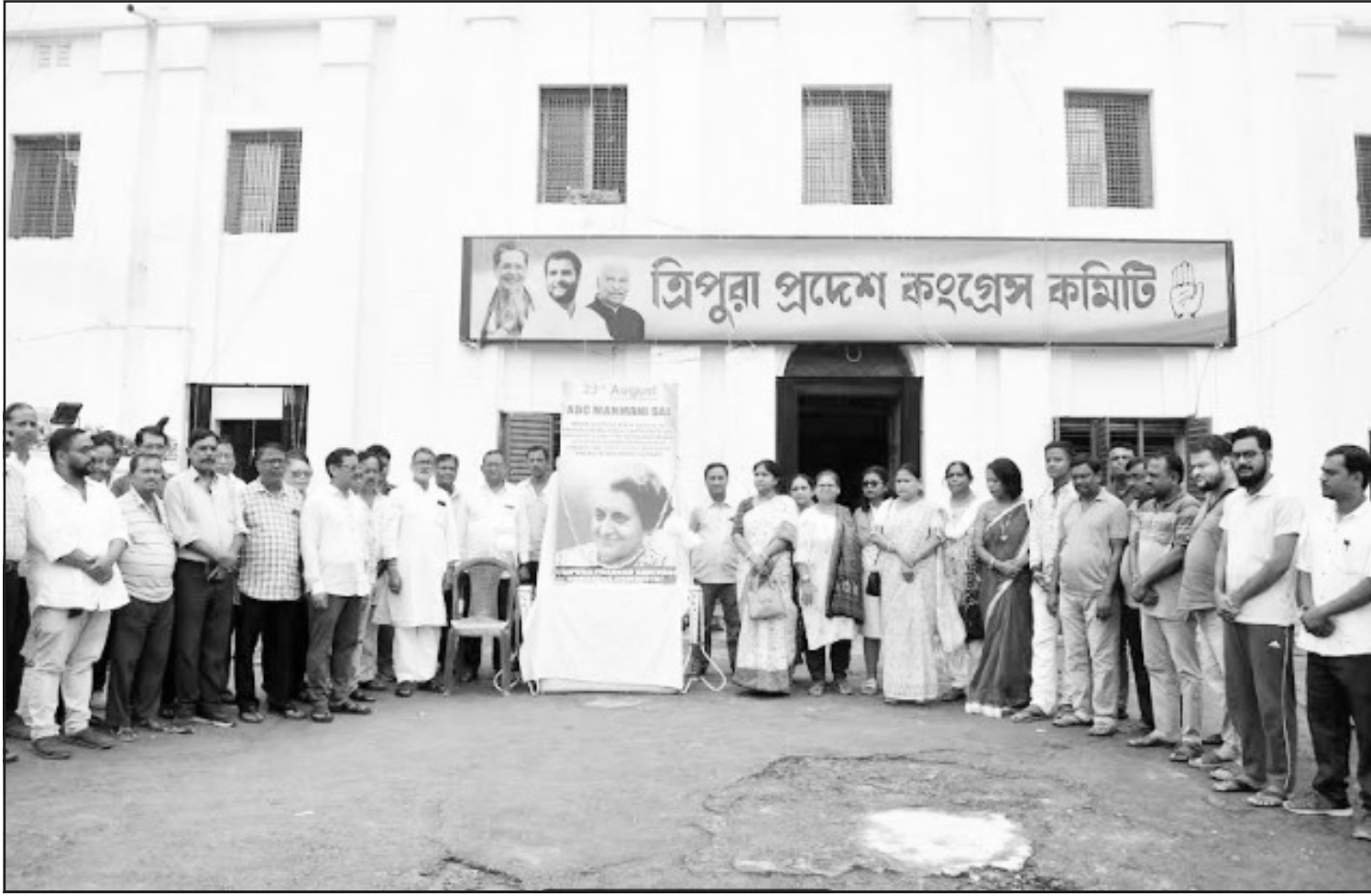
শুক্রবার কংগ্রেস সদর কার্যালয়ে আদিবাসী দিবস পালিত হয়। নিজস্ব ছবি।