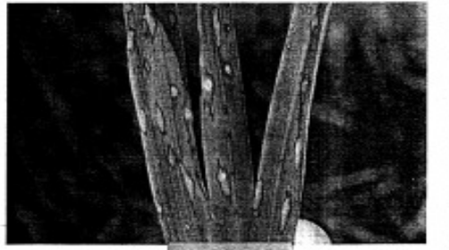
খলসা রোগ এবং ধসা রোগ

বন্যা পরবর্তী অবস্থায় ধানের পানির পোকা, চুলি পোকা এবং পাতামোড়ানো পোকার উপস্থিতি লক্ষ্য করা যেতে পারে। কীটপতঙ্গের আক্রমণ নিয়ন্ত্রণ করার জন্য পরামর্শগুলি অনুসরণ করা যেতে পারে: