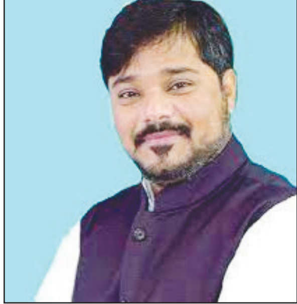
নেতৃত্বে গ্রামে নতুন সরকার ঘটন করছে। তাই তিনি এদিন নতুন সদস্যদের ধন্যবাদ জানান।

নিজস্ব প্রতিনিধি, আগরতলা, ৩০ আগস্ট: গ্রামকে শক্তিশালী করার পথ আরো মসৃণ করেছেন নরেন্দ্র মোদি।