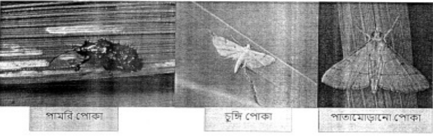
পানির পোকা, চুলি পোকা, পাতামোড়ানো পোকা

সৌজন্যে কৃষিতথ্যা শাখা রাজ্য কৃষি গবেষণা কেন্দ্র, অরুণাচলপ্রদেশ কৃষি ও কৃষক কল্যাণ দপ্তর ত্রিপুরা সরকার