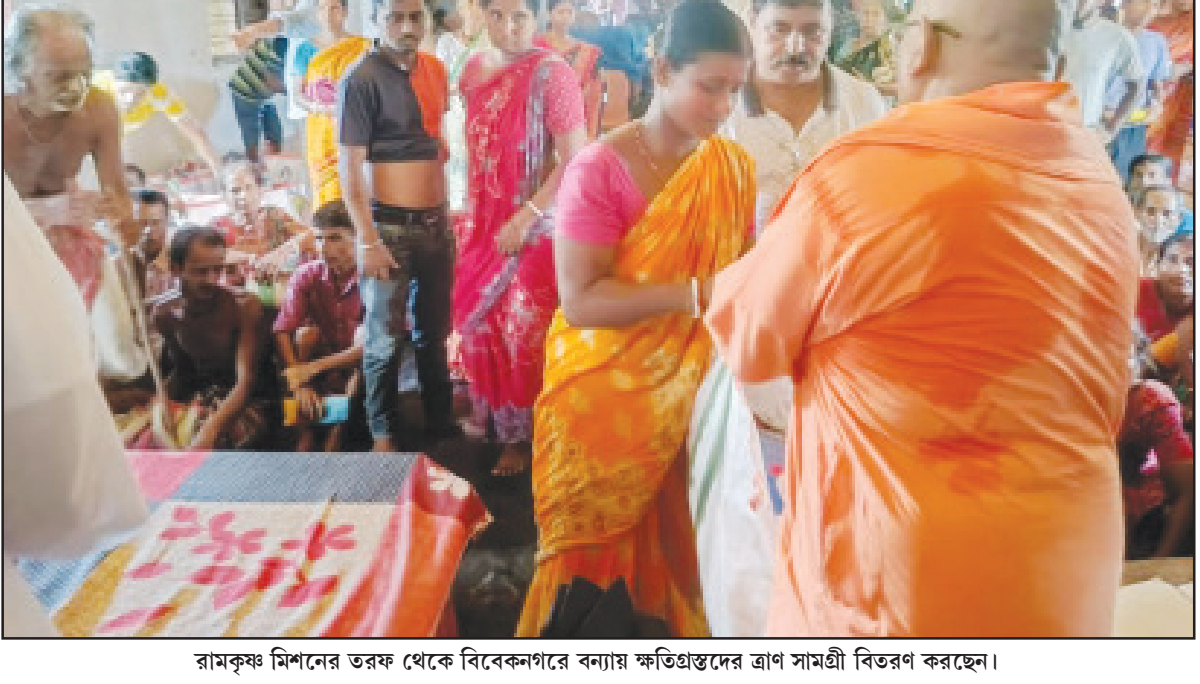
রাক্ষস মিশনের তরফ থেকে বিবেকগণের বন্যায় ক্ষতিগ্রস্তদের ত্রাণ সামগ্রী বিতরণ করছেন।