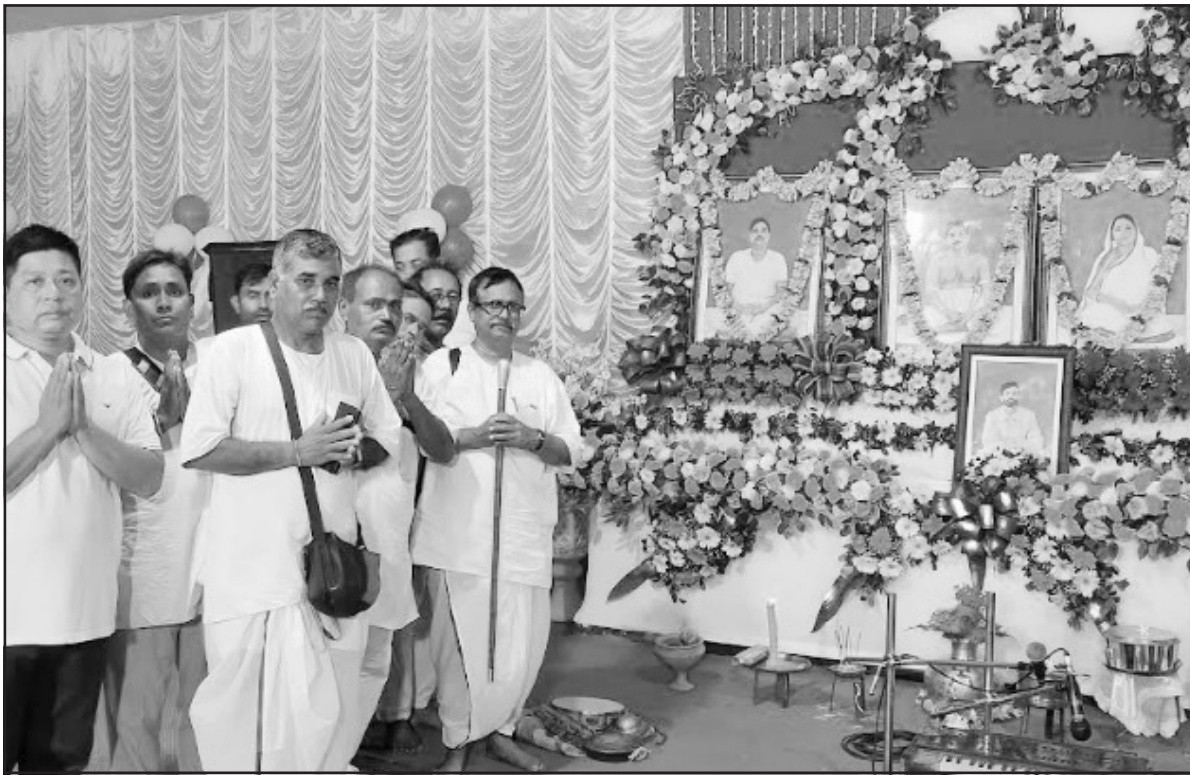
গুরুবীর অনুকূল চন্দ্রের ১৩৮তম জন্মবার্ষিকী পালিত হয়।