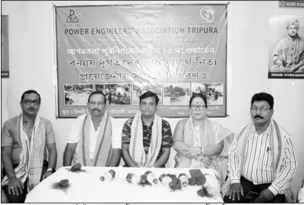
সোমবার আগরতলা ২০ নং ওয়ার্ডের উদ্যোগে এক সাংবাদিক সম্মেলনের আয়োজন করা হয়।