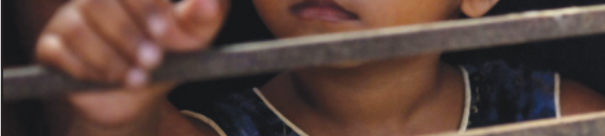
বীরগঞ্জে ত্রাণ সামগ্রী বন্টনের মাঝেই দেখা গেছে শিশুটির মনের অবস্থা।

গেছে। এখন তাঁর বাড়ি থেকে বন্যার জল নেমে গেছে। কিন্তু, রেশন কার্ড থেকে শুরু করে সমস্ত গুরুত্বপূর্ণ নথি হারিয়ে গেছে। ফলে, সরকারি সহায়তা পেতেও তাঁর সমস্যা হচ্ছে।