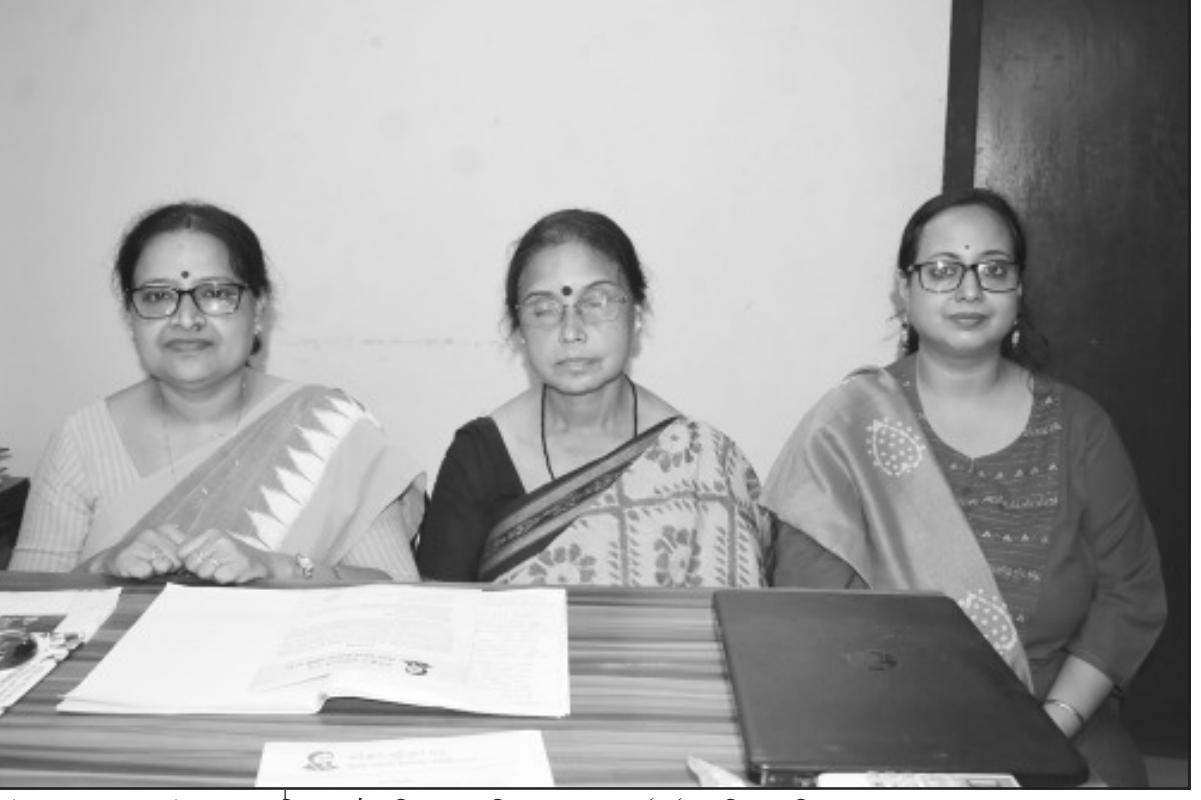
মাইকেল মধুসূদনের উপর আয়োজিত অনুষ্ঠান নিয়ে সাংবাদিক সম্মেলনে কর্মকর্তারা।

Sd/- (Nabadwip Jamatia) Principal KTDS Police Training Academy, Narsingarh, Tripura.