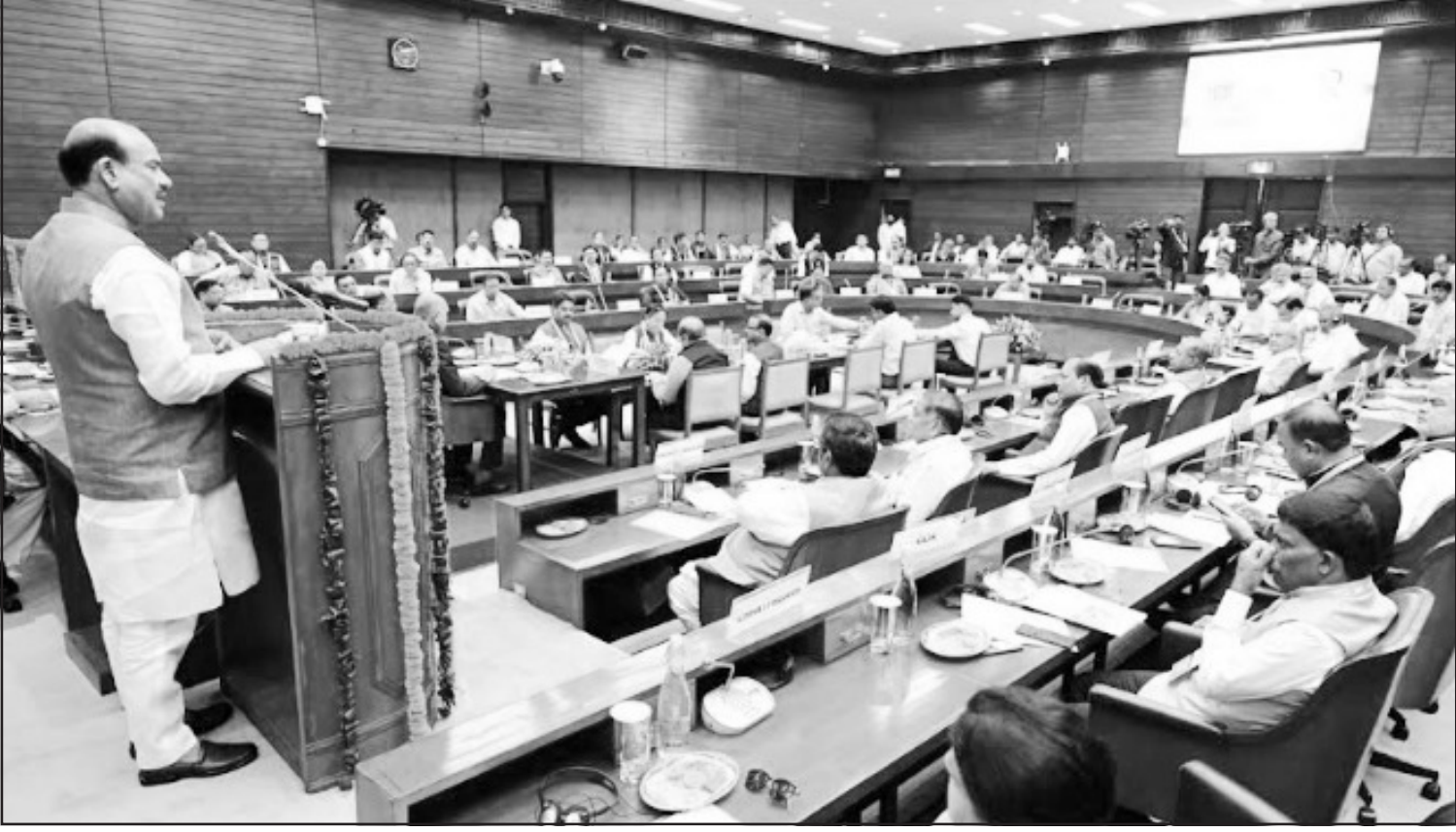
সোমবার লোকসভার স্পিকার ওম বিরলা পালার্মেন্টে এক বৈঠকে মিলিত হন।