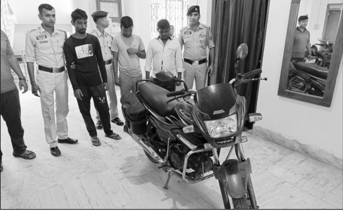
শুক্রবার এনএসিসি থানার পুলিশ একটি চুরির বাইক চোর সহ আটক করে।