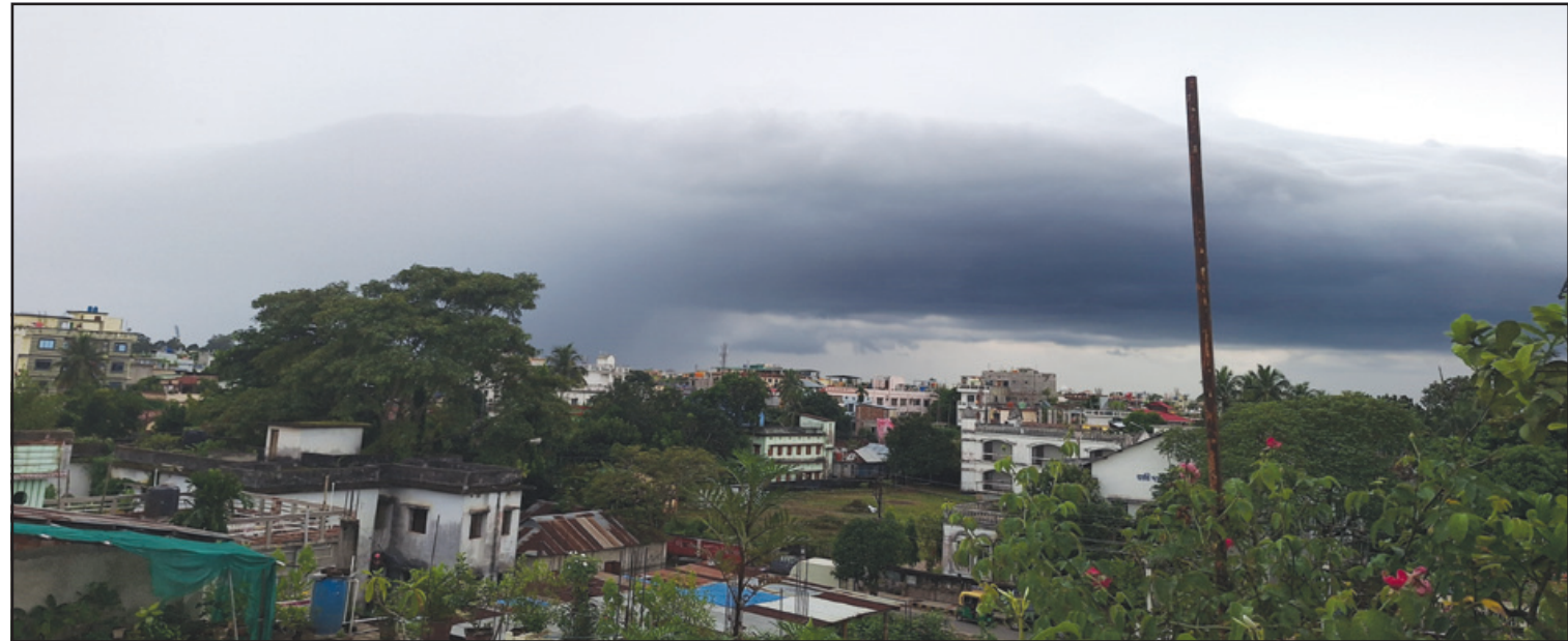
মনোমুগ্ধকর মেঘের পাহাড় রাজধানীর আগরতলার আকাশে। বৃহস্পতিবার দুপুরে এমনই ছবি ধরা পড়লো জাগরণের ক্যামেরার ল্যালে।

নিজস্ব প্রতিনিধি, আগরতলা, ২৪ অক্টোবর। বঙ্গোপসাগরে ক্রমশ শক্তি বৃদ্ধি করছে "দানা"। ইতিমধ্যেই শক্তিশালী ঘূর্ণিঝড়ের চেহারা নিয়েছে দানা। নিম্নচাপের প্রভাবে রাজ্যের বেশ কিছু অঞ্চলে বৃষ্টিপাত হয়েছে। পূর্বাভাস অনুযায়ী রাজধানীতেও বৃষ্টি হয়েছে। আবহাওয়া দপ্তর থেকে দেওয়া পূর্বাভাস অনুযায়ী বৃহস্পতিবার সকাল থেকেই রাজধানীর আকাশ মেঘলা ছিল। দুপুর নাগাদ বেশ কিছুক্ষণ বৃষ্টি হয়েছে। পশ্চিম ও সিপাহিজলা জেলায় হালুদ সতর্কতা জারি করা হয়েছিল। সেই অনুপাতে এখানে তেমন ঝড় বৃষ্টি হয়নি। পশ্চিম জেলা ছাড়াও রাজ্যের আরো বেশ কয়েকটি জেলায় বৃষ্টিপাত হয়েছে। অন্যদিকে রাজ্যের কিছু জেলায় আকাশ ভারী হয়ে আছে, কিন্তু বৃষ্টির দেখা এখনও পাওয়া যায় নি। মৌসম বিভাগ জানিয়েছে, আজ মধ্যরাত এবং শুক্রবার ভোরের উত্তর ওড়িশা এবং পশ্চিমবঙ্গ উপকূলে পূর্ণি এবং সাগরদ্বীপের মধ্য দিয়ে সাইক্লোন অতিক্রম করতে পারে। ঝড়ের গতিবগ্ন হতে পারে ঘণ্টায় ১০০-১১০ কিমি। সর্বোচ্চ বেগ হতে পারে ঘণ্টায় ১২০ কিমি। পশ্চিমবঙ্গের আবহাওয়া দপ্তর জানিয়েছে, আজ থেকে ২৯ অক্টোবর পর্যন্ত দক্ষিণবঙ্গের জেলাগুলিতে বৃষ্টিপাতের সম্ভাবনা রয়েছে। প্রবল বৃষ্টির সম্ভাবনায় দক্ষিণ ২৪ পরগনা, দুই মেদিনীপুরে লাল সতর্কতা জারি করা হয়েছে।