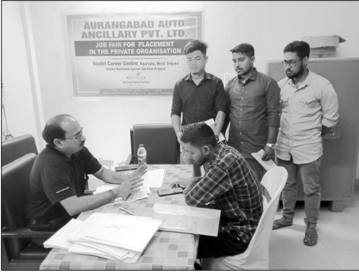
বৃহস্পতিবার আগরতলায় একটি চাকরি মেলায় প্রত্যাশিতরা ইন্টারভিউ প্রদান করেন।