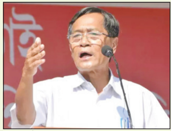
তাই প্রদ্যোৎ এর সাজানো রাজনীতি করে যাচ্ছেন প্রদ্যোৎ। মানুষের ভরসা নষ্ট করেছেন তাই মানুষ এখন প্রশ্ন তুলেছেন তাঁর বিরুদ্ধে।

নিজস্ব প্রতিনিধি, আগরতলা, ২৪ অক্টোবর। জনজাতিদের আবেগকে ব্যবহার করেছেন প্রদ্যোৎ কিশোর দেববর্মণ। মানুষ তাঁর উপর অন্ধ বিশ্বাস করেছিলেন। কিন্তু মানুষকে ঠকিয়েছেন তিনি। দীর্ঘ ৬ বছর ধরে এই বিভিন্ন সময়ে বিভিন্ন বক্তব্যের মাধ্যমে প্রদ্যোৎ কিশোর জনজাতি মানুষ বিশেষ করে যুব সমাজের আবেগকে ব্যবহার করেছেন।