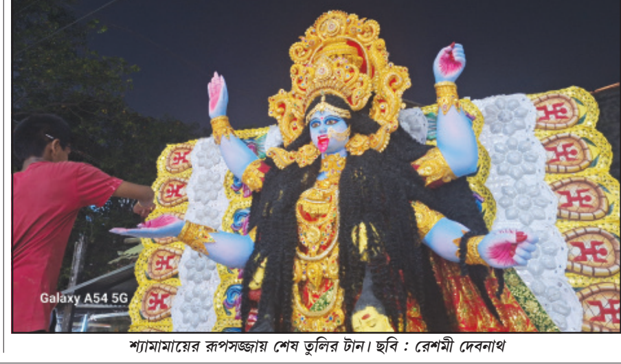
শ্যামামায়ের রূপসজ্জায় শেষ তুলির টান।

১৮ কোটির ইয়াবা সহ আটক দুই নিজস্ব প্রতিনিধি, আগরতলা, ৩০ অক্টোবর ॥ গোপন সংবাদের ভিত্তিতে অভিযান চালিয়ে দুই নেশা কারবারিকে আটক করতে সক্ষম হয়েছে আসাম রাইফেলস। সাথে ৯০ হাজার ইয়াবা ট্যাবলেট উদ্ধার করে। যার বাজারমূল্য আনুমানিক ১৮ কোটি টাকা হবে। আজ আসাম রাইফেলস তরফ থেকে ৬ এর পাতায় দেখুন