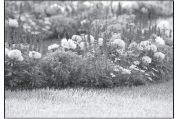
গাঁদাফুল- এই গাঁদাফুল বাগানে রাখা কিন্তু মোটেই সহজ নয়। তবে কলকাতা শহরে যারা ফুলের সঙ্গে বেশ কিছুক্ষণ সময় কাটান এবং ফুলগাছের যত্ন করতে পারেন, নিজের ছান্দবগানে বা বারান্দায় তাঁরা লাগিয়ে ফেলাতেই পারেন হস্তদ, কমলা, সাদা বিভিন্ন রঙের গাঁদা ফুল।

ধারকে আকর্ষণীয় করে তুলবে, তাই নয়, মন ভাল রাখতেও এই ফুলের জুড়ি মেলা ভার। অর্কিড- অর্কিড এখন কলকাতার ফুলপ্রেমী মানুষের কাছে বিশেষ আকর্ষণের। এবং শীতকালে রংবেরঙের অর্কিড আপনার বাগানকে উজ্জ্বল করে রাখতে পারে। শুধু দরকার অল্প একটু দেখাশোনার। শীতের মাসগুলিতে বেশির ভাগ অর্কিডই তাদের বুদ্ধিকে শক্ত করে দেয়, এমনকি সুপ্ত অবস্থায়ও চলে যায়। তাই প্রতি সপ্তাহে জল দেওয়ার পরিবর্তে শীতকালে প্রতি ১০ দিন অন্তর অর্কিডগুলিকে জল দেওয়াই ভাল।