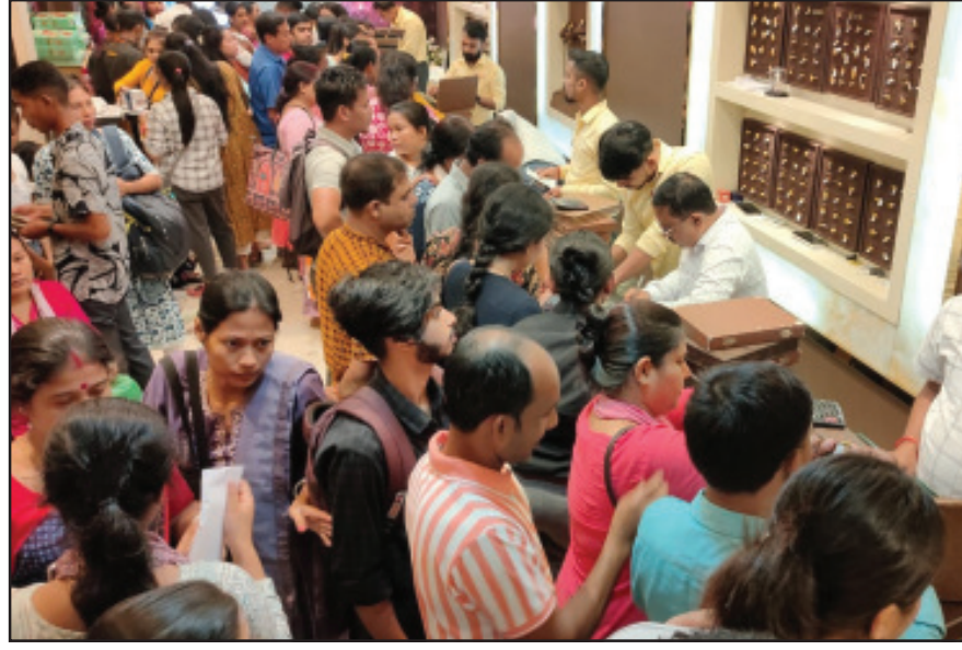
দীপাবলি ও ধনতেরাস উপলক্ষে বৃহস্পতিবার রাজধানীর বিভিন্ন জায়গায় শোকুম গুলিতে ধরা পড়ত এরকম ভিডিও চিত্র।