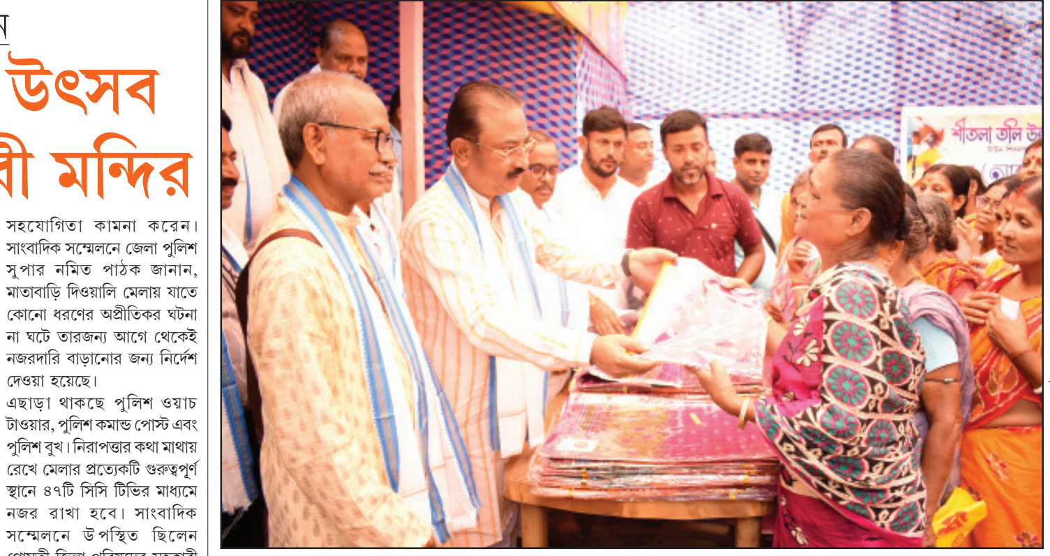
দীপাবলি উপলক্ষে দুঃস্থদের মধ্যে বস্ত্রদান করেন বিজেপি প্রদেশ সভাপতি তথা সাংসদ রাজীব ভট্টাচার্য।

পূজার আয়োজনে ক্লাবের সর্বমোট বাজেট চার লক্ষ টাকা। ক্লাব সদস্য জানান, এবছর চাঁদার অবস্থা খুবই খারাপ তাই পূজার খরচ মোটোতে গিয়ে হিমসিম খেতে হচ্ছে তাদেরকে। প্রশাসনিক নির্দেশ মেনে বাইরে থেকে চাঁদা সংগ্রহ করা বন্ধ রাখতে হচ্ছে। এই পরিস্থিতিতে ক্লাবের সদস্যদের চাঁদার পরিমাণ বাড়িয়ে দেওয়া হচ্ছে যাচিতি মেটানোর। সমস্ত প্রতিকূলতার মাঝেও ক্লাবের ঐতিহ্যকে টিকিয়ে রাখার লক্ষ্যে পূজায়ে অনা মাত্রায় পৌছে দিতে প্রাণপন চেষ্ঠা চালাচ্ছেন পূজা উদ্যোগতারা। বিগতদিনের মতো মুক্তিসূর্য ক্লাবের এবারের আয়োজনও দর্শনার্থীদের মন কাড়বে বলে আশাবাদী ক্লাব কর্মকর্তারা।