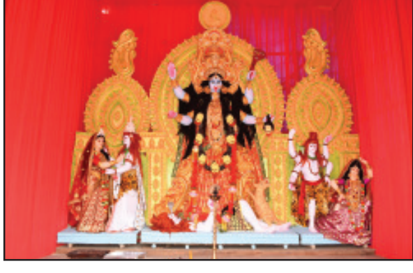
এক নজরে রাজ্যের বিভিন্ন প্রান্তে দীপাবলি উৎসব।

ভারপ্রাপ্ত মুদ্রক ও প্রকাশক সন্দীপ বিশ্বাস কর্তৃক রেণুবো প্রিন্টিং ওয়ার্কস, আগরণতলা থেকে মুদ্রিত ও জাগরণ কার্যালয় এল. এন. বাড়ী রোড, আগরণতলা, ত্রিপুরা থেকে প্রকাশিত। ভারপ্রাপ্ত সম্পাদক - সন্দীপ বিশ্বাস।