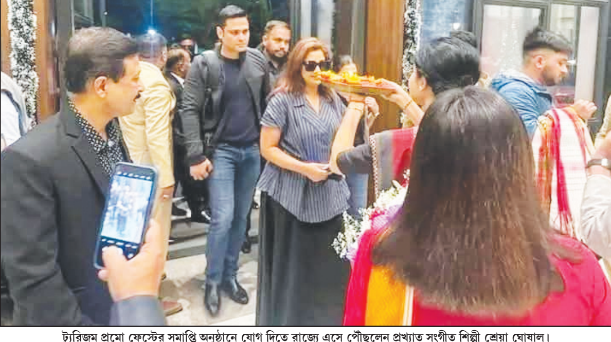
টুরিজম প্রমো ফেস্টের সমাপ্তি অনুষ্ঠানে যোগ দিতে রাজ্য এসে পৌঁছলেন প্রখ্যাত সংগীত শিল্পী শ্রেয়া ঘোষাল।