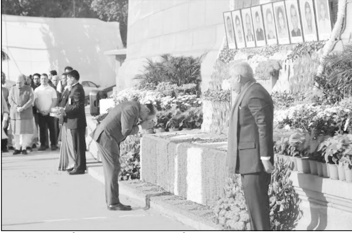
সংসদ হামলায় প্রয়াতদের প্রতি শ্রদ্ধা জানাচ্ছেন লোকসভার অধ্যক্ষ ওম বিড়লা।