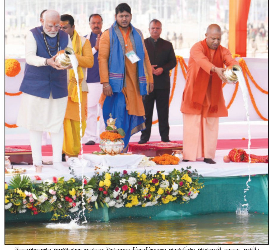
উত্তরপ্রদেশের প্রয়াগরাজে মহাকুস্ত উপলক্ষ্যে ত্রিবেনিসঙ্গমে পূজার্চনায় প্রধানমন্ত্রী নরেন্দ্র মোদী।