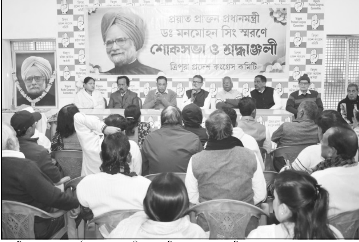
বৃহস্পতিবার কংগ্রেস সদর কার্যালয়ে প্রয়াত প্রধানমন্ত্রী মনমোহন সিংহের স্মরণ সভা আয়োজিত হয়।