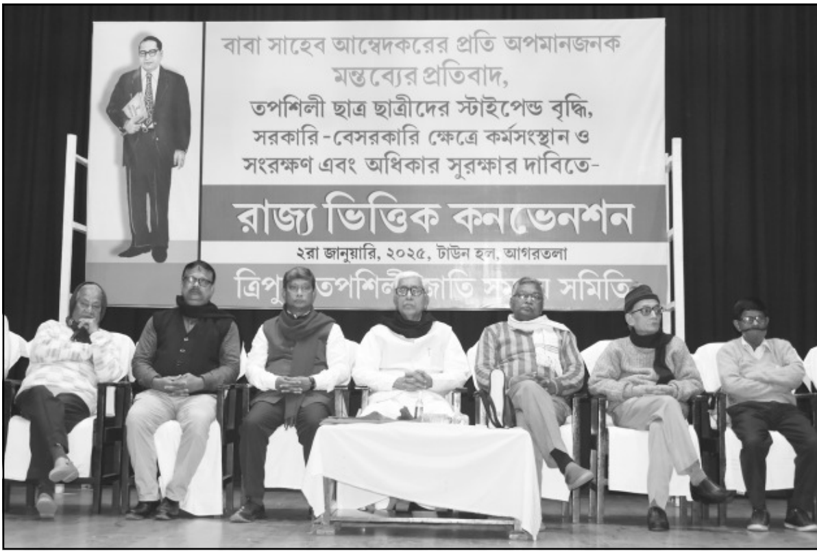
বৃহস্পতিবার আগরতলায় ত্রিপুরা তপশিলী জাতি সমন্বয় সমিতির উদ্যোগে রাজ্য ভিত্তিক কনভেনশন আয়োজিত হয়।