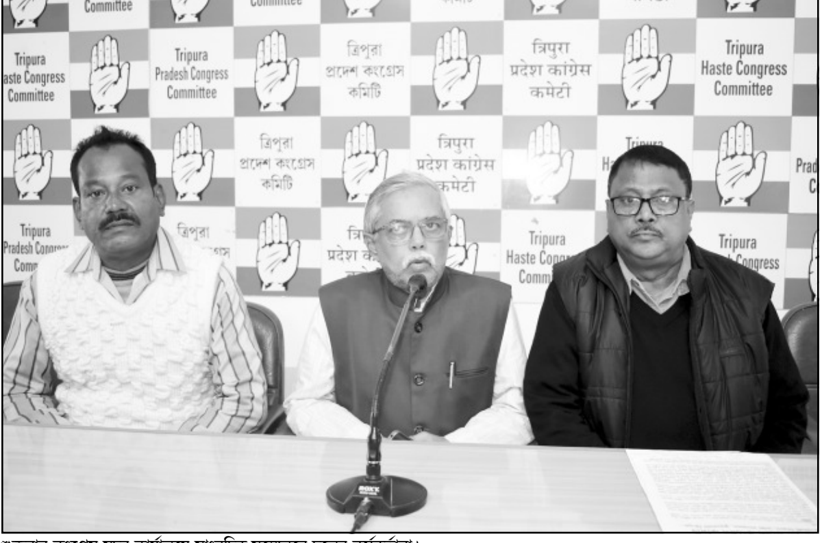
শুক্রবার কংগ্রেস সদর কার্যালয়ে সাংবাদিক সম্মেলনে দলের কর্মকর্তারা।

দুবাই, ২৪ জানুয়ারি (হিস.): ভারতের তারকা ব্যাটার স্মৃতি মঙ্কানা এবং অলরাউন্ডার দীপ্তি শর্মা শুক্রবার ২০২৪ সালের আইসিসি মহিলা ওয়ানডে অল স্টার দলে নির্বাচিত হয়েছেন, কিন্তু ভারতের পুরুষ প্রতিপক্ষদের মধ্যে কেউই শ্রীলঙ্কা, পাকিস্তান এবং আফগানিস্তানের অধিপতাপূর্ণ পুরুষদের দলে জায়গা পাননি। মহিলা অল-স্টার দলে দুই ভারতীয় ছাড়াও ইংল্যান্ডের ও জন, অস্ট্রেলিয়ার দুইজন, দক্ষিণ আফ্রিকার দুইজন এবং শ্রীলঙ্কা ও ওয়েস্ট ইন্ডিজের একজন করে খেলোয়াড় রয়েছে। ২০২৪ সালে ১২ ম্যাচে ৬৯৭ রান করা দক্ষিণ আফ্রিকার ব্যাটার লরা ওলভার্ডকে আইসিসি দলের অধিনায়ক মনোনীত করা হয়েছে। ভারতের পুরুষরা অবশ্য আইসিসি একাদশে অনুপস্থিত। এটি গত বছর দেশের হয়ে ওড়িআই খারাপ পারফরমেন্সকে দায়ী করা হয়েছে। ২৮ বছর বয়সী মঙ্কানা ২০২৪ সালে মহিলাদের ওয়ানডেতে সর্বোচ্চ রান সংগ্রহক হওয়ার জন্য ১৩ ম্যাচে ৭৪৭ রান সংগ্রহ করে ছিলেন। তিনি আইসিসি মহিলা ওয়ানডে ক্রিকেটার অফ দ্য ইয়ার পুরস্কারের দৌড়ে রয়েছেন।