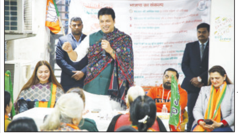
নিজস্ব প্রতিনিধি, আগরতলা, ২৪ জানুয়ারি: দিল্লি বিধানসভা নির্বাচন উপলক্ষে আজ শুক্রবার কস্তুরবানগর বিধানসভার লাজপত নগরের বিক্রম বিহারে মাতৃশক্তির সাথে অর্থপূর্ণ আলোচনা অনুষ্ঠিত হয়েছে বলে সামাজিক মাধ্যমে বলেছেন সাংসদ বিপ্লব কুমার দেব। তিনি বলেন, বিজেপি সরকার সমগ্র দেশে নারীদের সম্মান ও নিরাপত্তা নিশ্চিত করার জন্য যে কাজ করেছে তা সকলের সামনে।