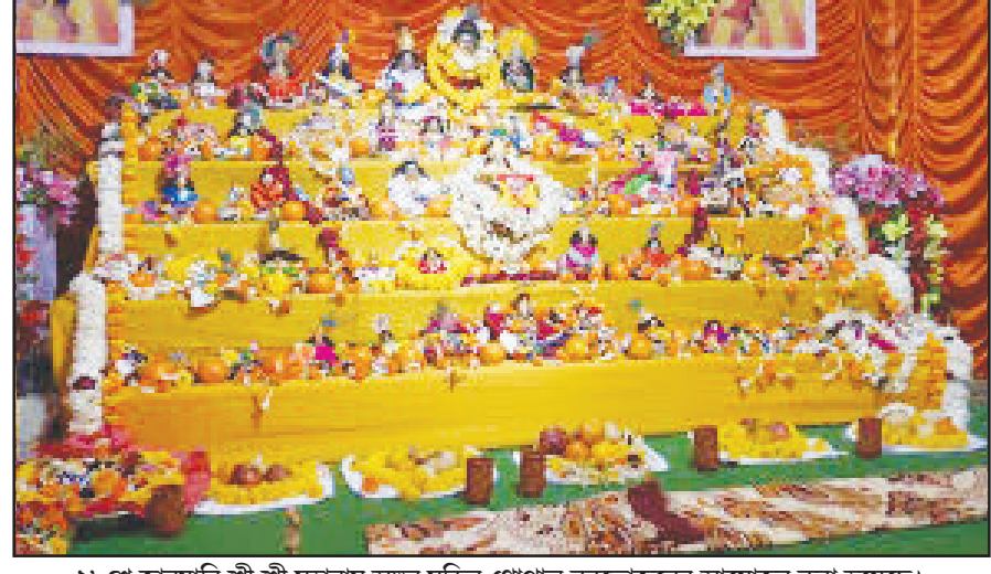
২৮শে জানুয়ারি শ্রী শ্রী মহামান্য অঙ্গন মন্দির গোপাল বনভোজনের আয়োজন করা হয়েছে।

নিজস্ব প্রতিনিধি, আগরতলা, ২৪ জানুয়ারি: অল ত্রিপুরা কমিস্ট এন্ড ড্রাগিস্ট অ্যাসোসিয়েশনের পক্ষ থেকে আগরতলা প্রেসক্লাবে শুক্রবার এক রক্তদান শিবির অনুষ্ঠিত হয়। কমিস্ট এন্ড ড্রাগিস্ট অ্যাসোসিয়েশনের সর্বভারতীয় সংগঠনের ৫০ বছর পূর্তি উপলক্ষে দেশব্যাপী সামাজিক কর্মসূচির অঙ্গ থেকে আগরতলা প্রেসক্লাবে আজ এক রক্তদান শিবির অনুষ্ঠিত হয়।