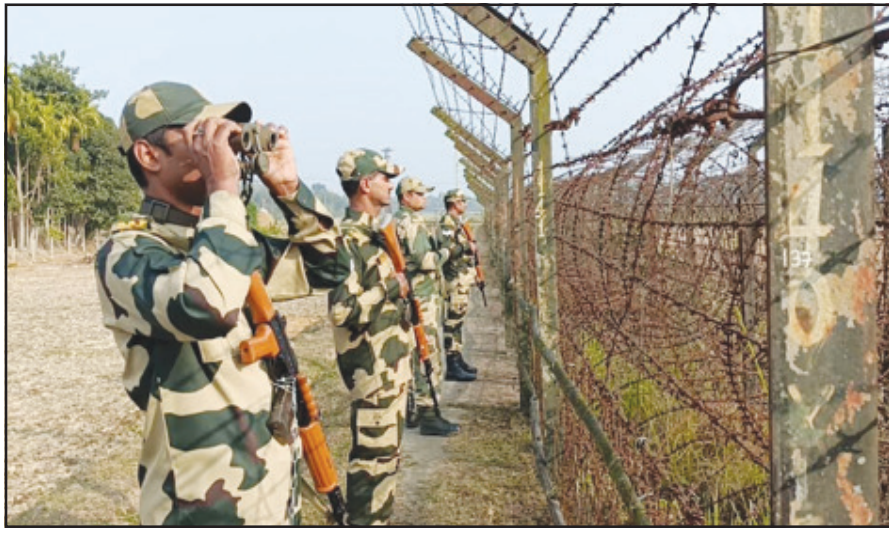
ইয়াকুবনগর এলাকায় প্রজাতন্ত্র দিবসের প্রাক্কালে চলছে সীমান্ত সুরক্ষা বাহিনীর নজরদারি।

নিজস্ব প্রতিনিধি, ধর্মনগর, ২৪ জানুয়ারি। প্রজাতন্ত্র দিবস উপলক্ষে সীমান্ত এলাকায় জারি রাখা হয়েছে বাড়তি নজরদারি। বিএসএফ জওয়ানরা প্রতিনিয়ত সীমান্তের কাঁটাতার বেড়া এলাকায় টহলদারি চালিয়ে যাচ্ছে। একইসঙ্গে ডগ স্কোয়ার্ড বাহিনীর নজরদারির কাজ ব্যবহার করা হচ্ছে। বলাতে গেলে নিচিহ্ন নিরাপত্তা ব্যবস্থায় মুড়ে ফেলা হয়েছে ভারত-বাংলাদেশ সীমান্তবর্তী এলাকা গুলি। বাংলাদেশের অনুপ্রবেশ রংগতে কড়া পদক্ষেপ নেওয়া হয়েছে। বাড়তি নিরাপত্তা ব্যবস্থা রাখতে জোয়ানরা দিনরাত টহল দিচ্ছেন। এদিকে রাজধানী আগরতলা সহ শহরের বিভিন্ন জায়গায় পুলিশ টহল বাড়ানো