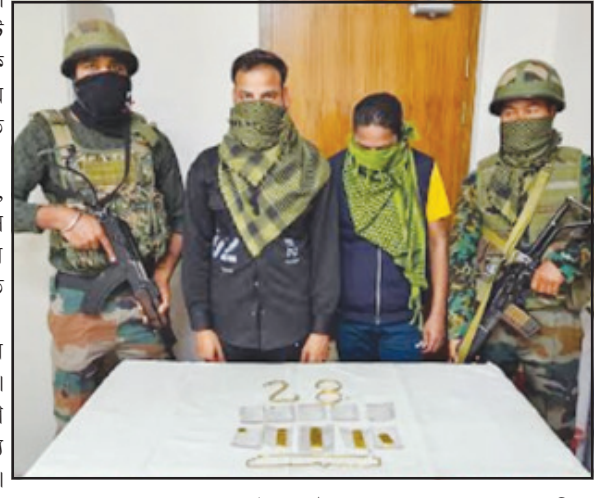
উদ্ধার করা হয়েছে। পাশাপাশি, আরেকটি ১০.২ কোটি টাকার গাঁজা বাজেয়াপ্ত করা হয়েছে।

নিজস্ব প্রতিনিষি, আগরতলা, ২২ ফেব্রুয়ারি।। গোপন সংবাদের ভিত্তিতে আসাম রাইফেলস এবং কাস্টমস বিভাগ দেশা বিরোধী অভিযানে বড়সড় সাফল্য পেয়েছে। আসাম রাইফেলসের যৌথ অভিযানে ২২৮৬.৯ কেজি গুন্দো গাঁজা বাজেয়াপ্ত করা হয়েছে। যার বাজারমূল্য আনুমানিক ১০ কোটি টাকা হবে। সাথে দুই নেশাকারবারিকে গ্রেফতার করা হয়েছে। আজ আসাম রাইফেলস তরফ থেকে এক বিবৃতি জারি করে জানানো হয়েছে। এদিন বিবৃতিতে জানানো হয়েছে, গোপন সংবাদের ভিত্তিতে খবর আসে পশ্চিম ত্রিপুরা জেলার বিজয়নগর এলাকায় বিপুল পরিমাণ গাঁজা মজুত রয়েছে। সেই খবরের ভিত্তিতে আজ ভোরে এলাকায় অভিযান চালিয়েছে। অভিযানে ২২৮৬.৯ কেজি গাঁজা উদ্ধার করা হয়েছে। যার বাজারমূল্য আনুমানিক ১০.২৯ কোটি টাকা হবে। সাথে ফলে দুই ব্যক্তিকে গ্রেপ্তার করা হয়। জপকৃত মাদকদ্রব্য এবং আটক