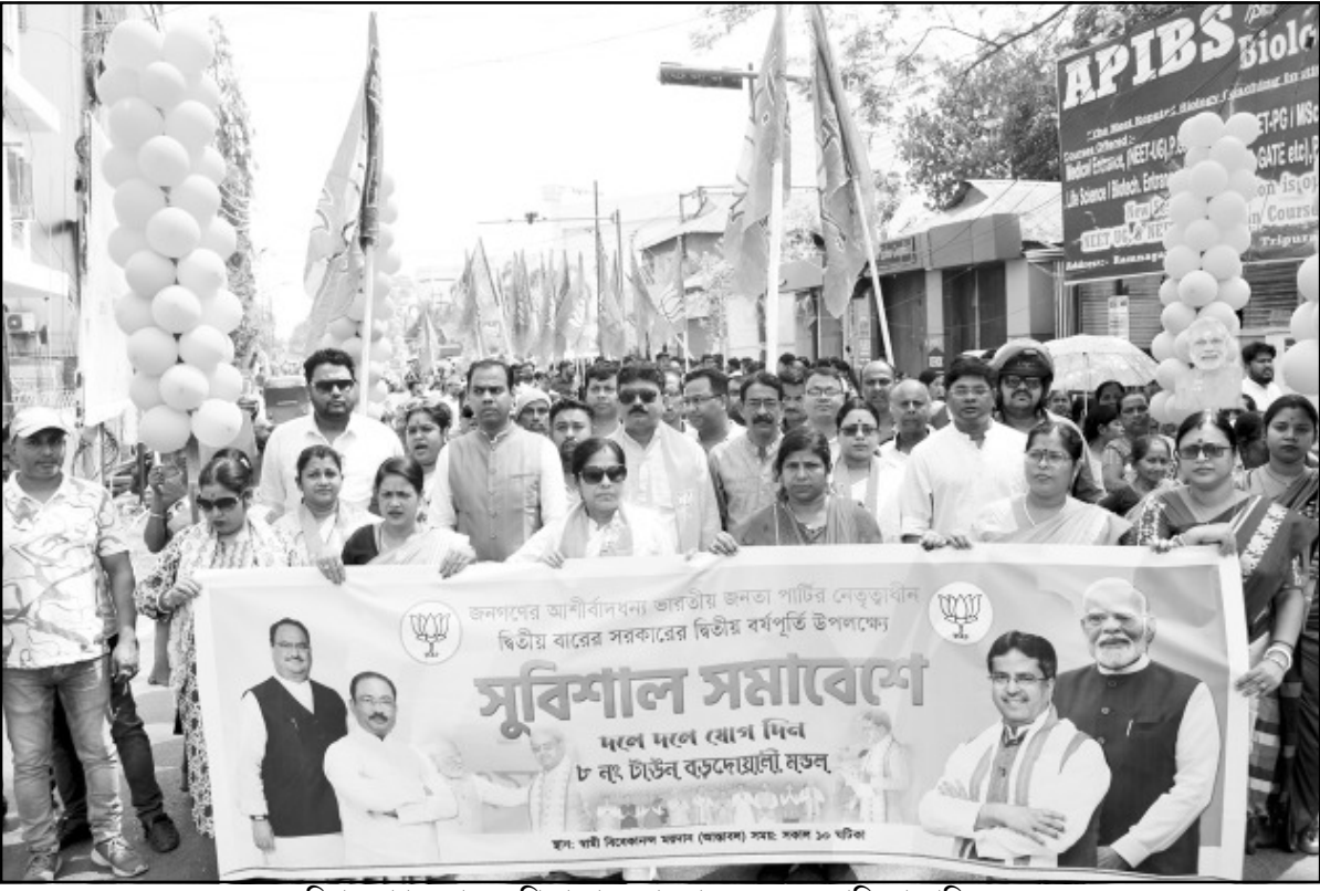
রবিবার আগরতলায় জেপি নাড্ডার সমাবেশ কেন্দ্র করে র্যালি আয়োজিত হয়।