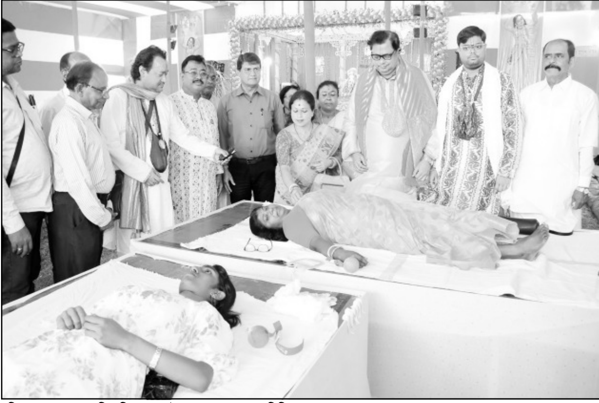
রবিবার আগরতলায় হরি ভক্তি সংঘের উদ্যোগে এক রক্তদান শিবিরের আয়োজন করা হয়।