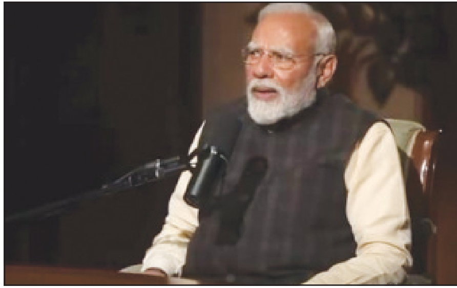
বলেছেন, 'ছোটবেলায় আরএসএসের শাখায় যোগ দিতে সবসময়ই ভালো লাগত। আমার দেশের কাজে নিয়োজিত হওয়া। সবসময় একটাই লক্ষ্য ছিল, 'সঙ্ঘ' (আরএসএস) আমাকে

নয়া দিল্লি, ১৬ মার্চ (হি.স.)।। আরএসএস-এর চেয়ে বড় "স্বয়ংসেবী সঙ্ঘ" পৃথিবীতে আর নেই। এই মন্তব্য করলেন প্রধানমন্ত্রী নরেন্দ্র মোদী। প্রধানমন্ত্রী মৌদী বলেছেন, 'আমি নিজেকে ভাণ্ডার মনে করি যে, আমি আরএসএসের মতো একটি সম্মানিত সংগঠনের কাছ থেকে জীবনের সারমর্ম এবং মূল্যবোধ শিখেছি। আমি একটি উদ্দেশ্যপূর্ণ জীবন পেয়েছি।'