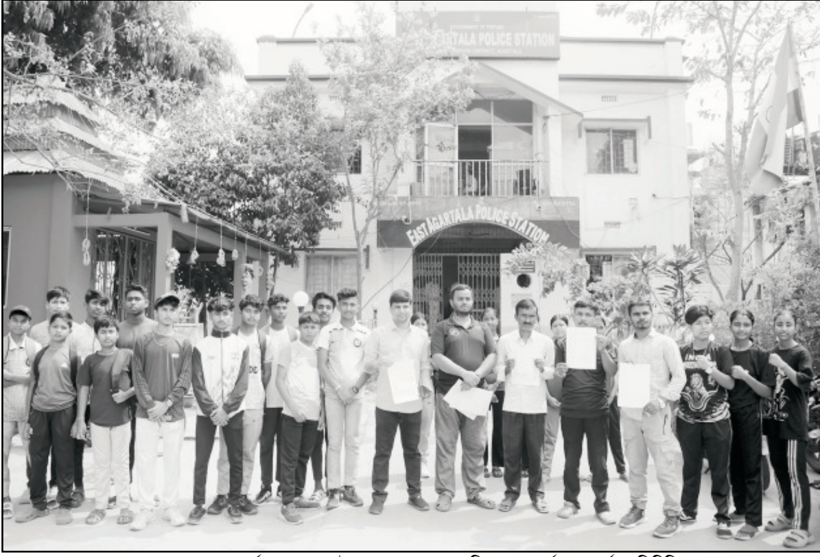
বুধবার আগরতলা পূর্ব থানায় ভূপেটেশন প্রদান করে অল ত্রিপুরা প্রোগ্রাম ফোরামের প্রতিনিধিরা।

বৃহস্পতিবার শ্রীভূমিতে জোনাল ম্যাজিস্ট্রেট, জোনাল ও সেক্টর অফিসারদের প্রশিক্ষণ শ্রীভূমি (অসম) ৮ এপ্রিল (হি.স.): আসন্ন পঞ্চায়েত নির্বাচন উপলক্ষে শ্রীভূমি জেলায় জোনাল ম্যাজিস্ট্রেট, জোনাল ও সেক্টর অফিসারদের এক প্রশিক্ষণ ১০ এপ্রিল, বুধবার বিকাল সাড়ে ৪টায় শ্রীভূমি শহরের জেলা গ্রন্থাগার প্রেক্ষাগৃহে অনুষ্ঠিত হবে। জেলা আয়ুক্ত এক আদেশে সংশ্লিষ্ট সবাইকে এই প্রশিক্ষণে উপস্থিত থাকতে নির্দেশ দিয়েছেন।