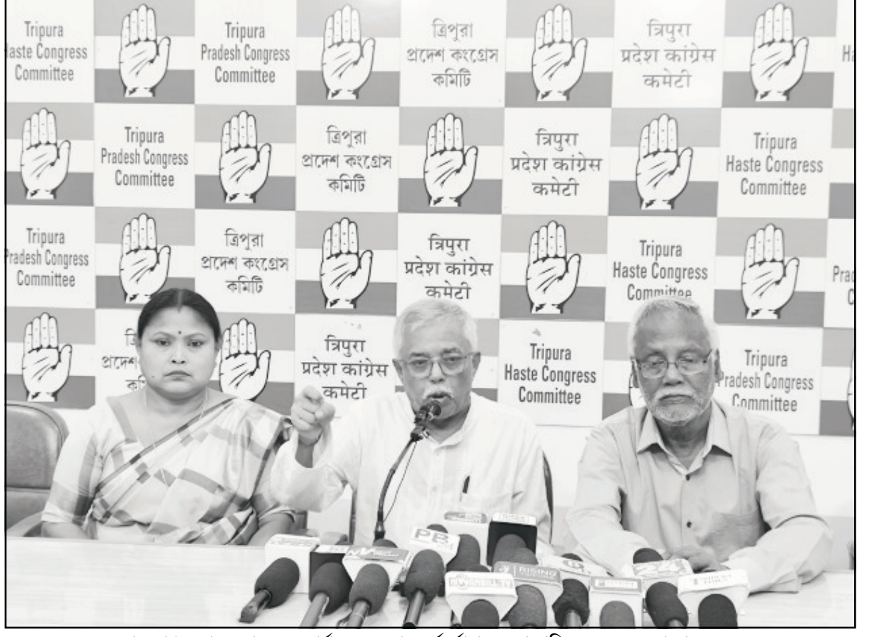
বুধবার আগরতলা কংগ্রেস সদর কার্যালয়ে কংগ্রেস কর্মকর্তারা এক সাংবাদিক সম্মেলনের আয়োজন করেন।