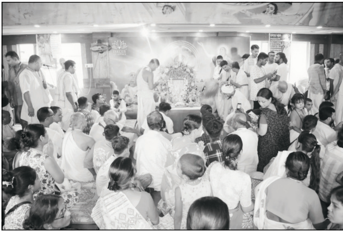
মঙ্গলবার আগরতলা ইসকন মন্দিরের উদ্যোগে লক্ষী পূজার আয়োজন করা হয়।