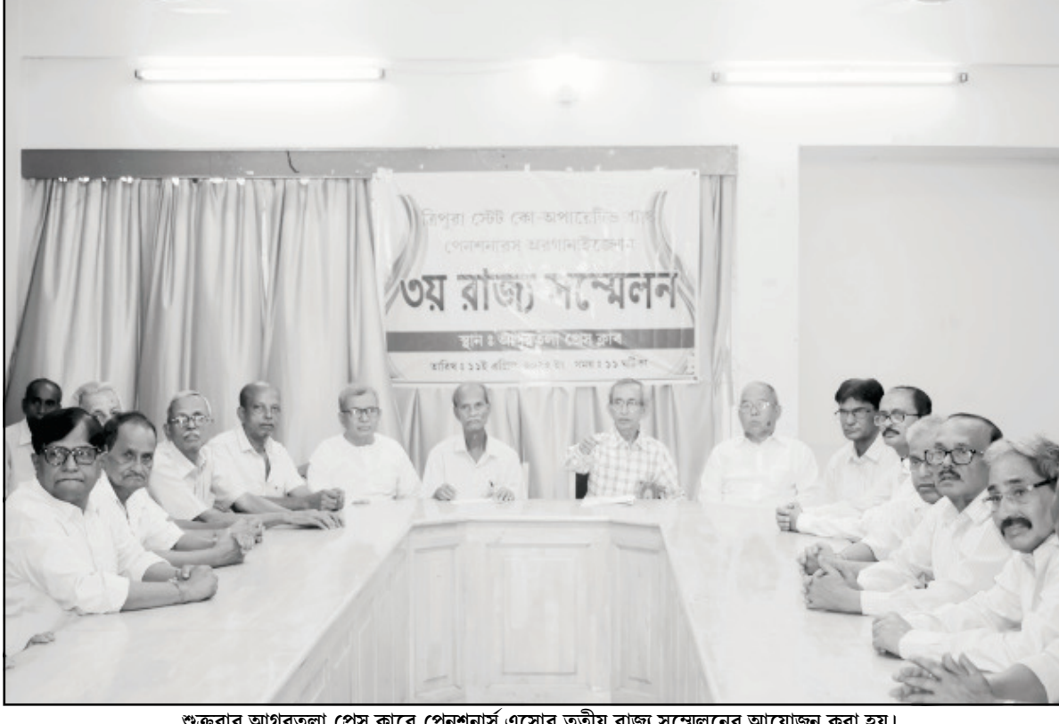
শুক্রবার আগরতলা প্রেস ক্লাবে পেনশনার্স এসোসিয়ারে তৃতীয় রাজ্য সম্মেলনের আয়োজন করা হয়।