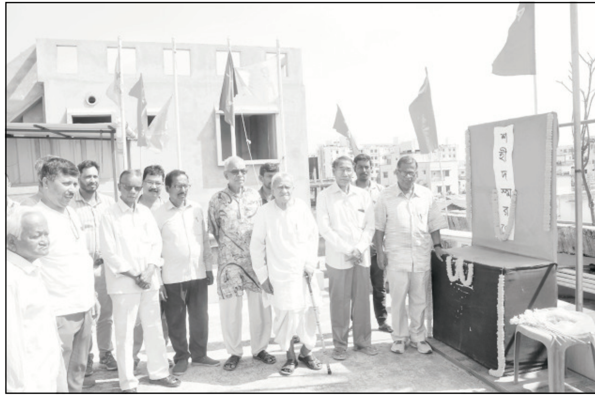
শুক্রবার আগরতলায় ক্ষেত্র মজদুর ইউনিয়নের প্রতিষ্ঠা দিবস পালিত হয়।