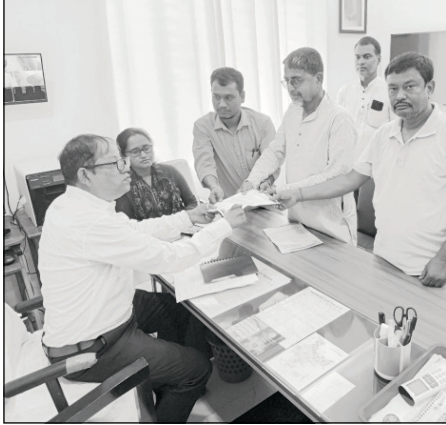
শুক্রবার আগরতলায় কংগ্রেসের প্রবিন্সি সেকেলের উদ্যোগে এক ডেপুটিশন প্রদান করা হয়।