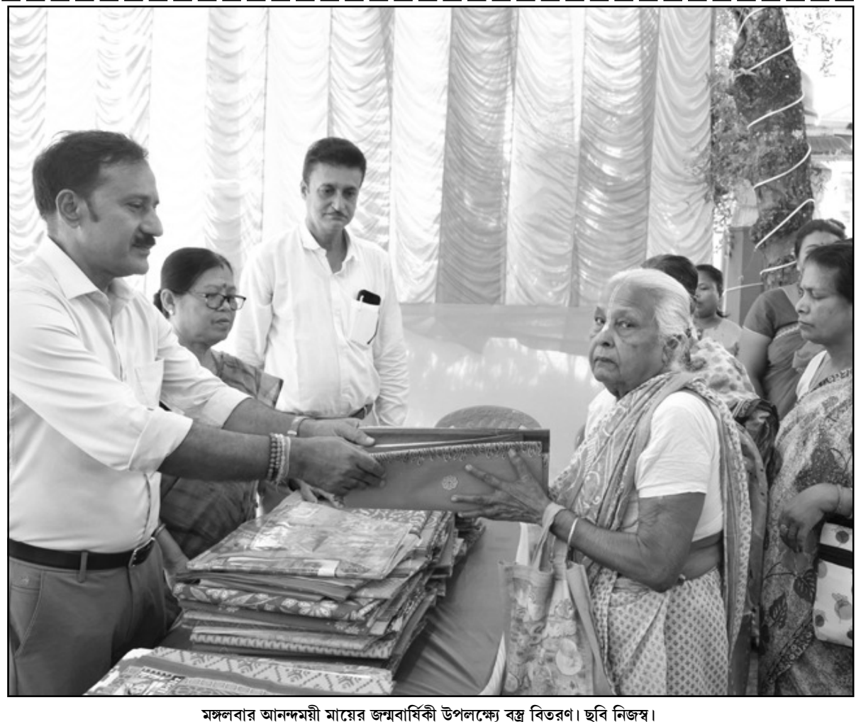
মঙ্গলবার আনন্দময়ী মায়ের জন্মবার্ষিকী উপলক্ষে বন্ধু বিতরণ।

রায়গাড়া ও বিশাখাপত্তনম ডিভিশনের মধ্যে নতুন সীমানা নির্ধারণ করা হয়েছে সিংগাপুর রোড—বিজয়ানাগর সেকশনকে ধরে। উল্লেখ্য, গত ২৮ এপ্রিল বিশাখাপত্তনমে একটি অনুষ্ঠানে রেলমন্ত্রী অশ্বিনী বৈষ্ণব ঘোষণা করেছিলেন যে ১ জুন থেকে এই নতুন রেলওয়ে জোন কার্যকর হবে। সেদিন তিনি অন্ধ্রপ্রদেশের মুখ্যমন্ত্রী এন. চন্দ্রবাবু নাইডু-এর সঙ্গে নতুন জোনের কার্যক্রমও পর্যালোচনা করেন। বর্তমানে বিশাখাপত্তনম ডেভেলপমেন্ট রিজিয়ন (ডিএমআর ডিএ)-র দফতরে অস্থায়ীভাবে এই জোনের কার্যালয় স্থাপন করা হয়েছে।