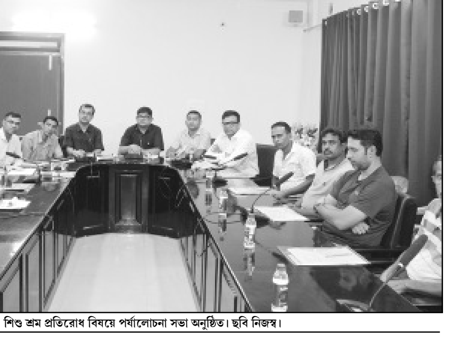
শিশু শ্রম প্রতিরোধ বিষয়ে পর্যালোচনা সভা অনুষ্ঠিত। ছবি নিজস্ব।