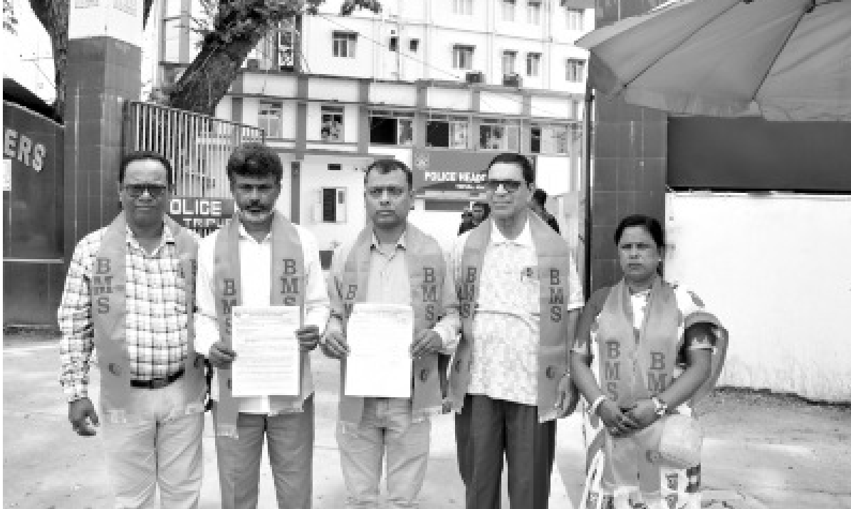
মঙ্গলবার বিএমএস-র প্রতিনিধি দল পুলিশ সদর দপ্তরে গিয়ে ডেপুটিশন প্রদান করেন।