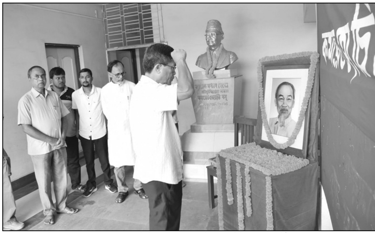
বিপ্লবের মহান নেতা কামরুজ হো চি মিনের ১৩৭ তম জন্মদিন পালন সিপি আই এম পার্টির রাজ্য দফতরে।